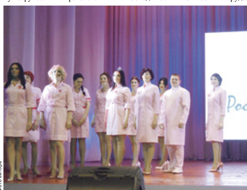
■ Выступление команды Пролетарского района на профессиональном конкурсе медсестер

Для первого тура конкурса участницы и участники несколько месяцев готовили номера, в которых поздравили область с юбилеем, а коллег – с профессиональным праздником. Также медсестры напомнили очередной раз о роли экологии, что особенно ярко было представлено во втором туре – дефиле экологических костюмов. Нововведением соревнования стал этап для болельщиков, где зрители с кричалками и транспарантами поддерживали свои районы не хуже футбольных фанатов.