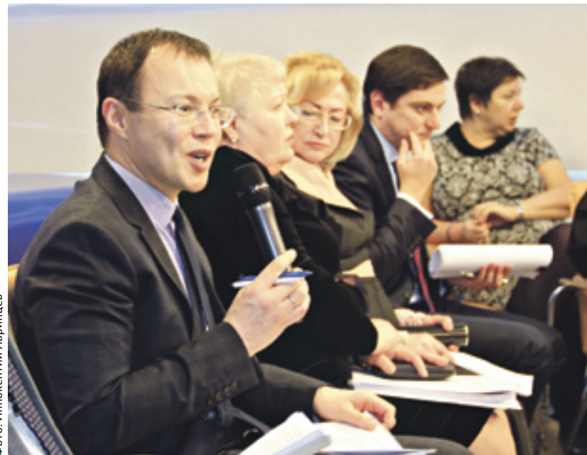
■ Эксперты обсудили вопросы банкротства в пресс-центре «ДОН-МЕДИА»

В 2017 году требования к процедуре банкротства физических лиц могут быть значительно упрощены. В частности, Министерство юстиции и Минэкономразвития России предлагают включить в этот процесс нотариусов, что позволит сделать его более быстрым и дешевым. Подобные поправки в ФЗ могут привести к резкому росту банкротств и отрицательно сказаться на экономике Ростовской области, прогнозируют специалисты.