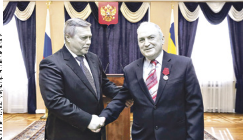
Более 60 героев уборки получили заслуженные награды