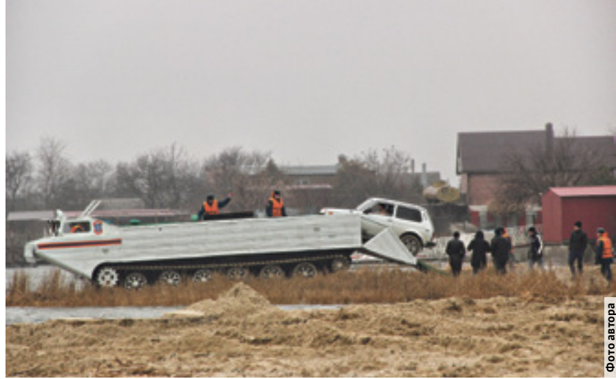
Противоподавковые учения, 2016 г.