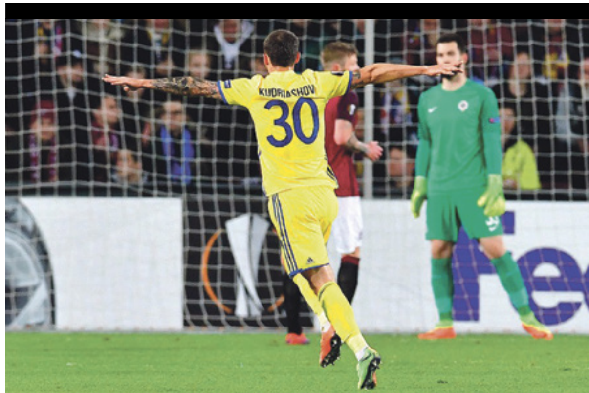
■ Прага. 23 февраля. «Спарта» – «Ростов» – 1:1

7 8-800-200-58-88 Горячая линия «Почты России»