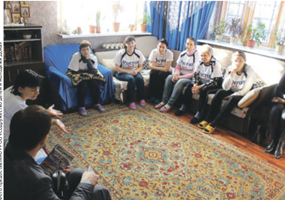
С подопечными женского реабилитационного центра