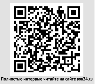
Полностью интервью читайте на сайте don24.ru

Поскольку незрячие воспринимают мир на слух и тактильно, им нужно аудиопояснение того, что происходит на экране. Голос тифлокомментатора звучит между репликами артистов. Самое главное – это донести, где происходит действие, кто в нем участвует, и, если есть время, описать элементы сценографии, окружения, детали костюмов.