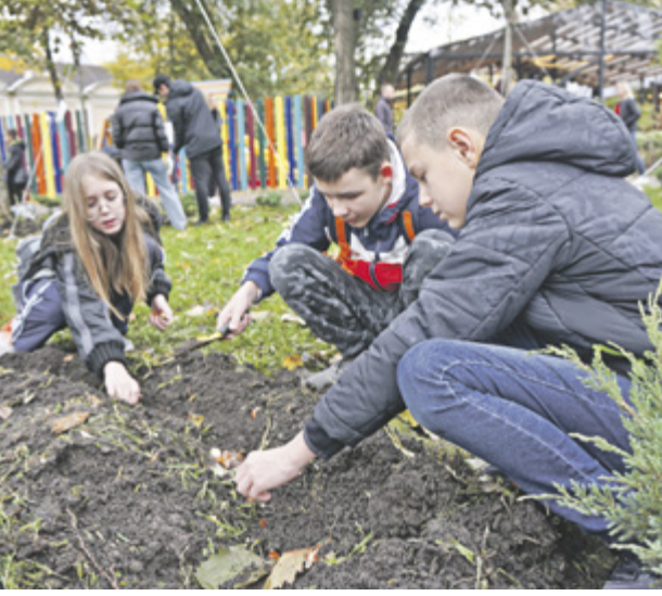
■ Ученики ростовского лицея № 51 аккуратно раскладывали луковицы тюльпанов в предварительно выкопанные борозды вокруг деревьев