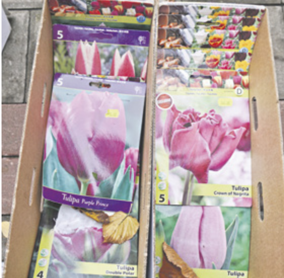
■ На аллее, ведущей к Покровскому храму, весной можно будет увидеть розовые тюльпаны