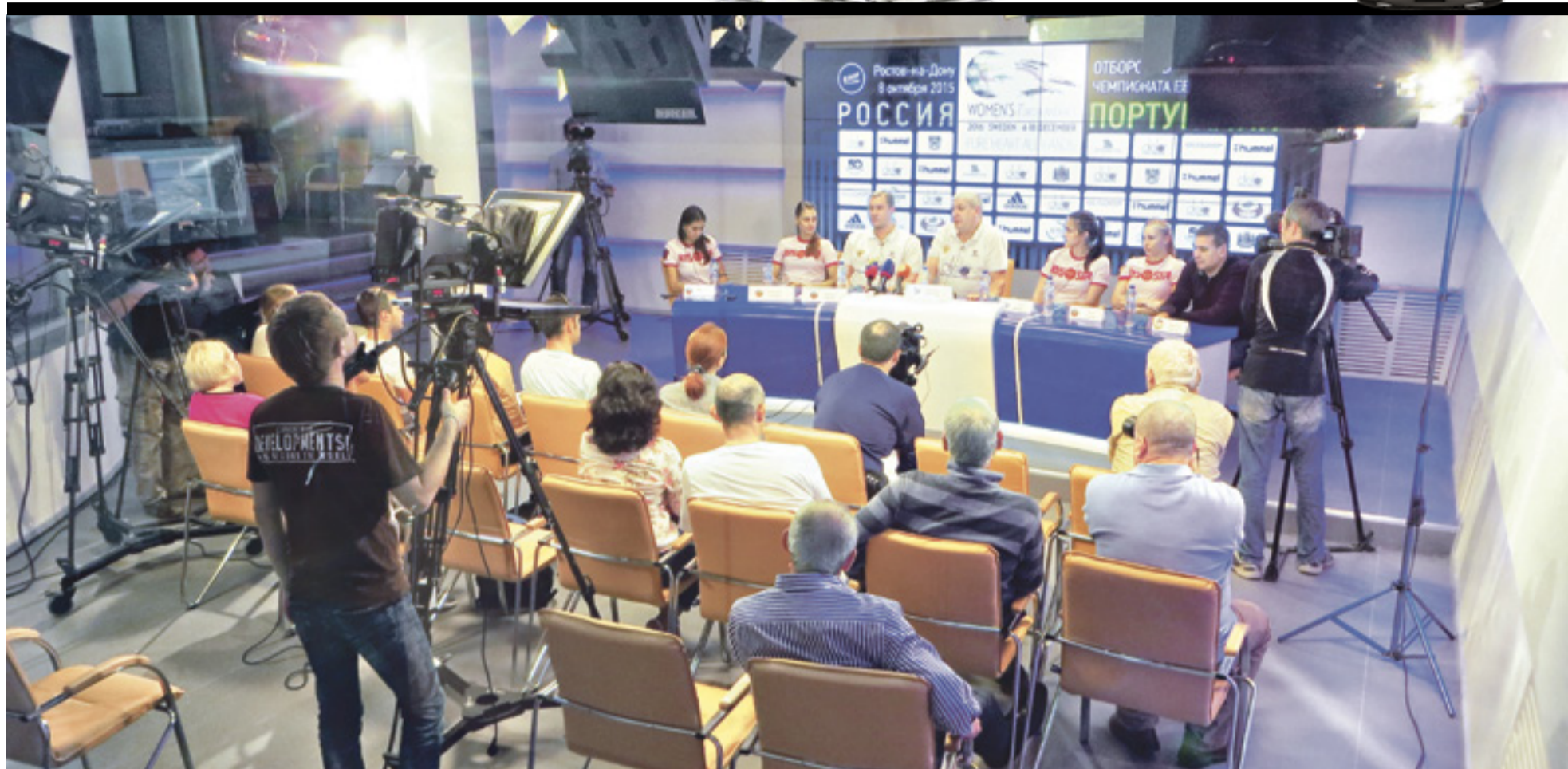
■ Информация от топовых спикеров, прозвучавшая в пресс-центре «Дон-медиа», попадает в ленту информагентства «ДОН 24», на страницы газеты «Молот» и в выпуски новостей радио «ФМ-на Дону» и телеканала «ДОН 24»