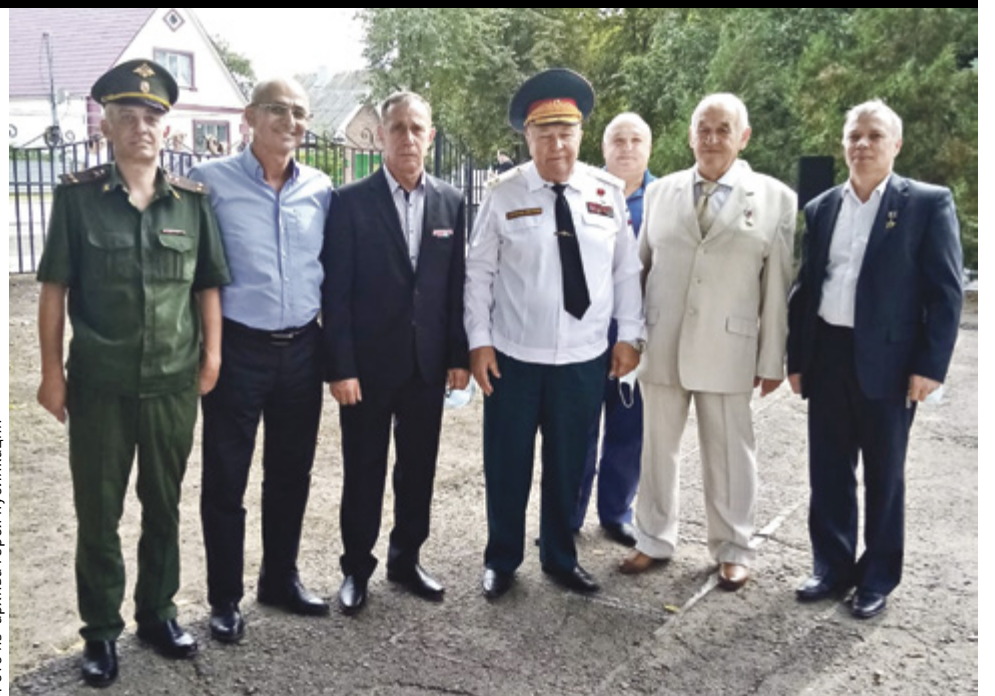
Фото из архива героя публикации