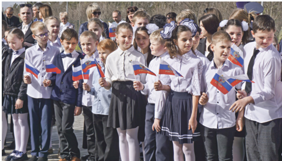
■ Нарядно одетые ребята с нетерпением ждут открытия новой школы

Под всем необходимым подразумеваются не только классы с компьютерами, но и актовый зал на 348 мест с современным концертным оборудованием, читальный зал, физическая и химическая лаборатории, кабинет робототехники, кабинеты