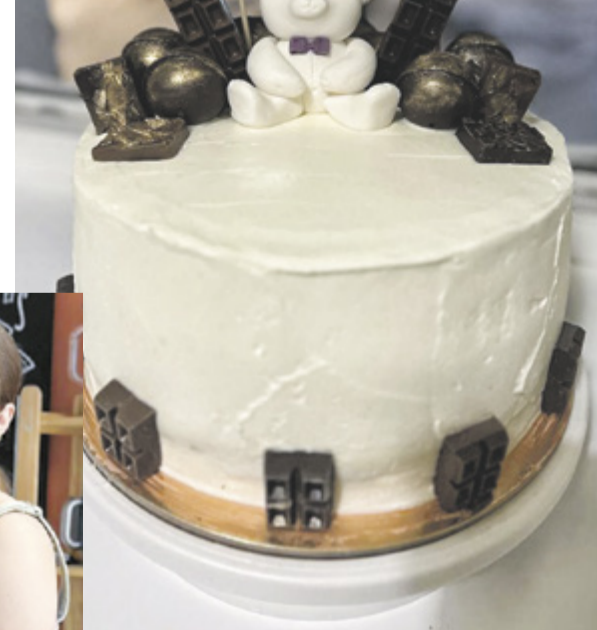
■ Торт, который был в телешоу

Постоянные зрители шоу о еде рассказывают, что проект «Кондитер. Дети» очень увлекательный, и многие повара дадут фору взрослым. После первого этапа отбора на съемки приглашают пять-семь человек, а из них в финал пройдет только один. Блюда конкурсантов оценивают звездные гости. Если гостям торт понравится, то победитель получает приз 500 тысяч рублей.