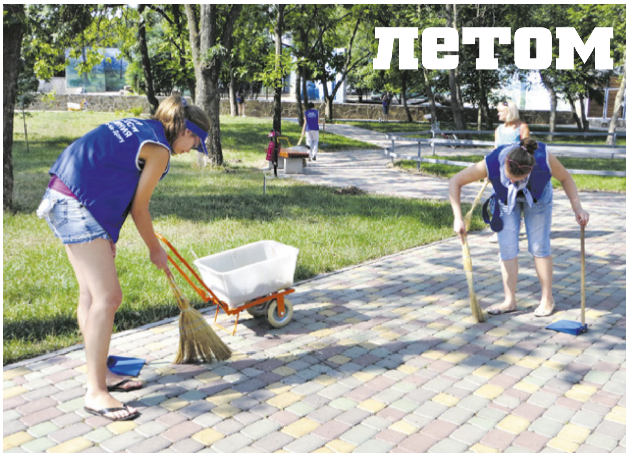
■ Работа на благоустройстве – таков у многих подростков первый трудовой опыт