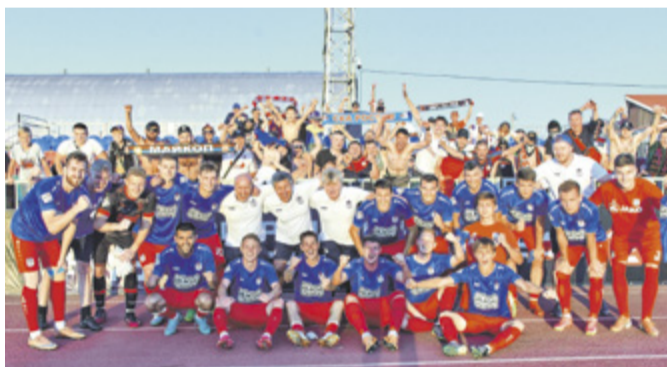
«Армейцы» одержали две победы подряд