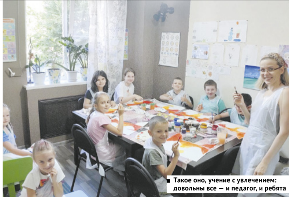
Такое оно, учение с увлечением: довольны все – и педагог, и ребята