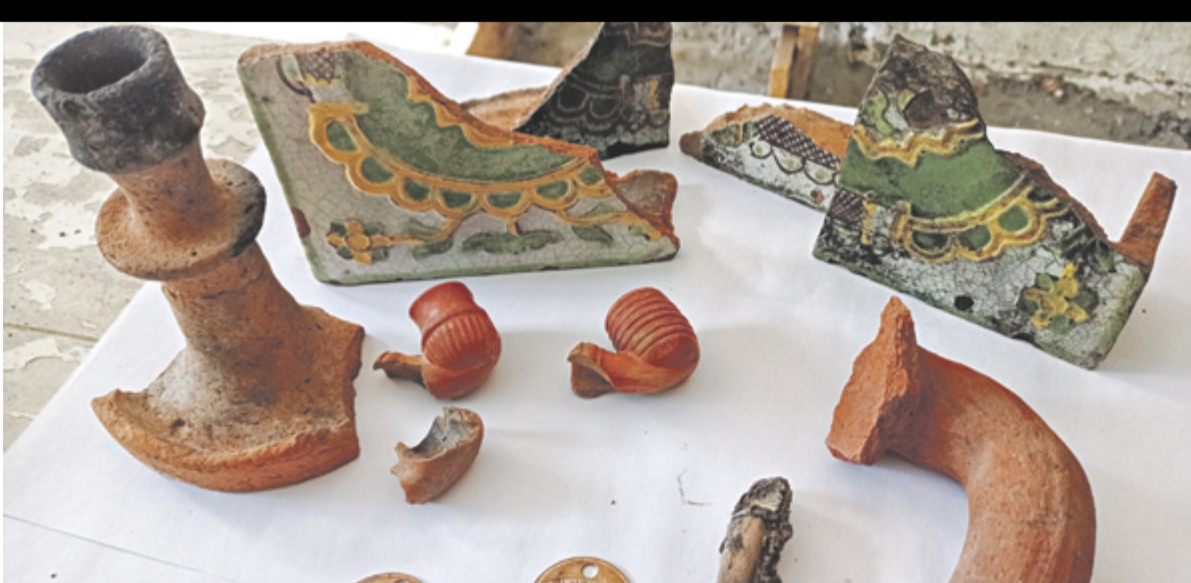
■ Среди находок археологов — обгорелый подсвечник, цветные изразцы, глиняные трубки, мундштук и жетоны

Меотов вытеснили другие кочевые племена. Гунны и готы, аланы и хазары, полновцы и печенеги — все они последовательно жили здесь. По донской земле проходили дружины князя Игоря и ватаги казаков, петровские полки и орды ногайцев. В 1779 году по указу императрицы Екатерины II здесь появились переселенные из Крыма арийские армяне. Они основали большой город. На нынешней улице Богданова