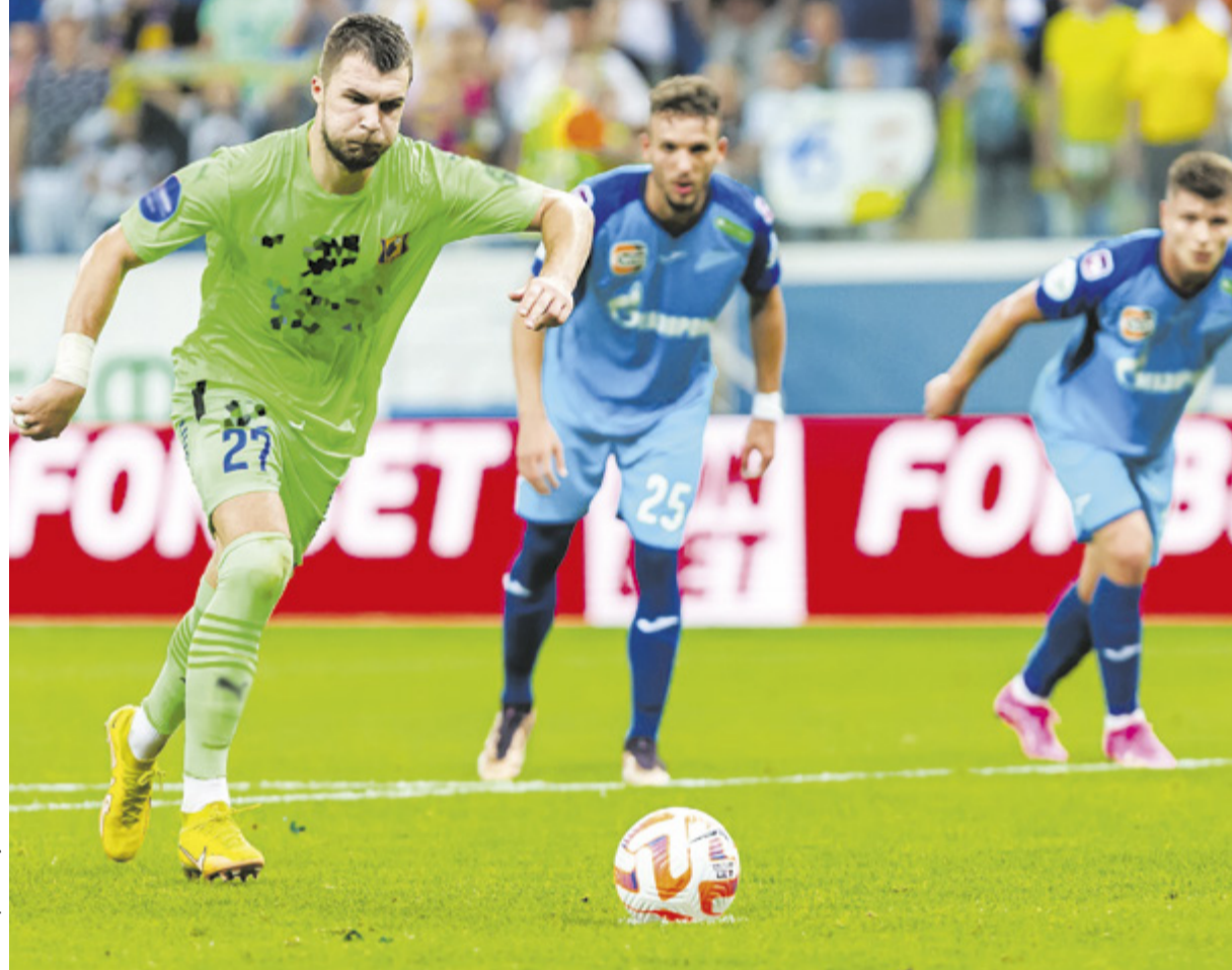
Удар Комличенко принес ростовчанам ничью