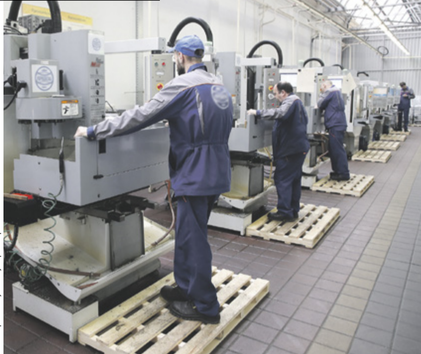
Российские компании могут снизить выплаты по налогу на прибыль, если покупают передовое оборудование отечественного производства