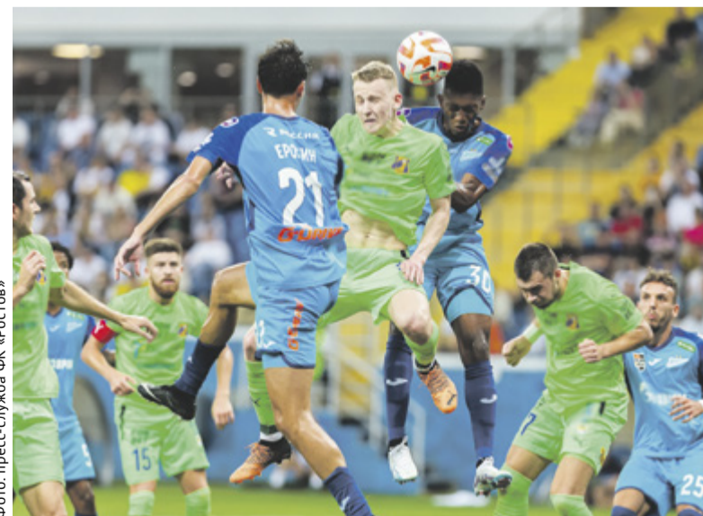
«Ростов» впервые в истории играл в форме другого цвета