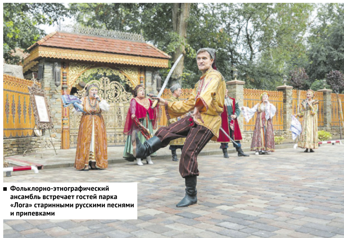
■ Фольклорно-этнографический ансамбль встречает гостей парка «Лога» старинными русскими песнями и припевами