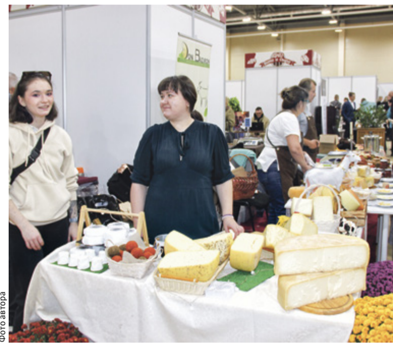
Местные производители смогли договориться о поставках своей продукции на единой площадке сразу с представителями 16 торговых сетей