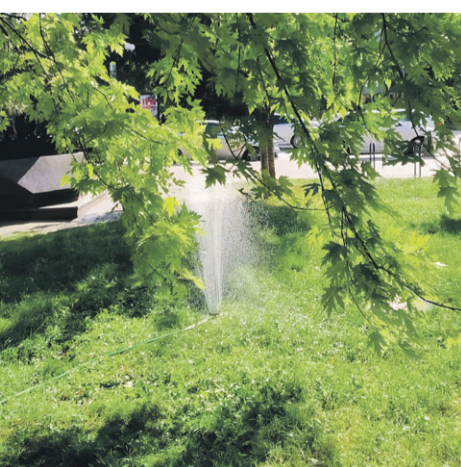
Деревья на Пушкинской поливает множество фонтанчиков. Сухие деревья необходимо убирать, так как они собирают вредителей