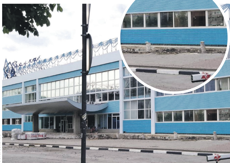
По словам представителей спортивного сообщества «Динамо», ели спилили потому, что их корневая система разрослась и стала угрожать каркасу фундамента бассейна

«Молот» также поинтересовался, как ухаживают за аллеей в районе домов №№ 75/3–75/5 на проспекте 40-летия Победы. Летом прошлого года жители микрорайона Александровка обращались в редакцию с жалобой, что деревья в этой пешеходной зоне остались без полива (об этом «Молот» писал в номере от 6 августа 2021 года). Также неравнодушные горожане не раз просили главу администрации Пролетарского района возобновить уходные работы. Вопрос о выделении денежных средств на эти нужды планировалось вынести на заседание ростовской Думы. Пока власти решили проблему, жильцы домов, расположенных возле аллеи, прикрутили шланги к своим кранам, самостоятельно стали поливать деревья, кустарники, газон и цветы. Попытались спасти то, что было посажено. В тот раз не выстояли как раз деревья хвойных пород. В этом году МКУ «Управление ЖКХ» Пролетарского района заключило договор с компанией «Эко-грин» на проведение работ по содержанию пешеходной зоны на проспекте 40-летия Победы. По контракту предусмотрен и уход за зелеными насаждениями.