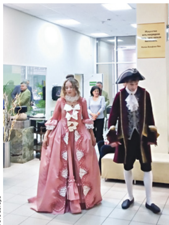
■ Гости музейной ассамблеи разучили с царем и его женой Екатериной придворный танец

Ассамблеи проводились в домах петербургской знати по очереди, в обязательной программе значились танцы, угощения, светские разговоры, обсуждение новостей. Кстати, на праздник могли пожаловать все желающие, кроме крестьян, и лично пообщаться с царем. По праздникам он облачался в кафтан, расшитый золотом, а по будням предпочитал простую одежду голландского шкипера.