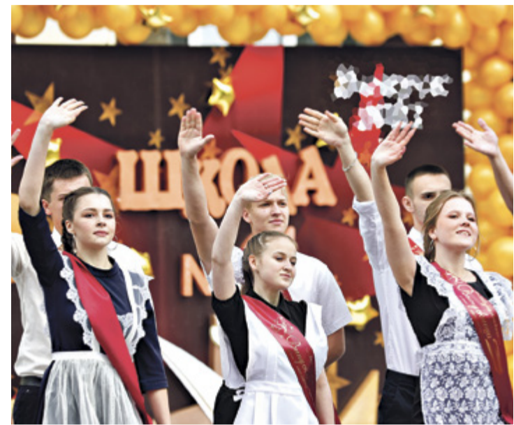
■ Весной продажи передников увеличились на 63%, а украшений для волос – на 44%