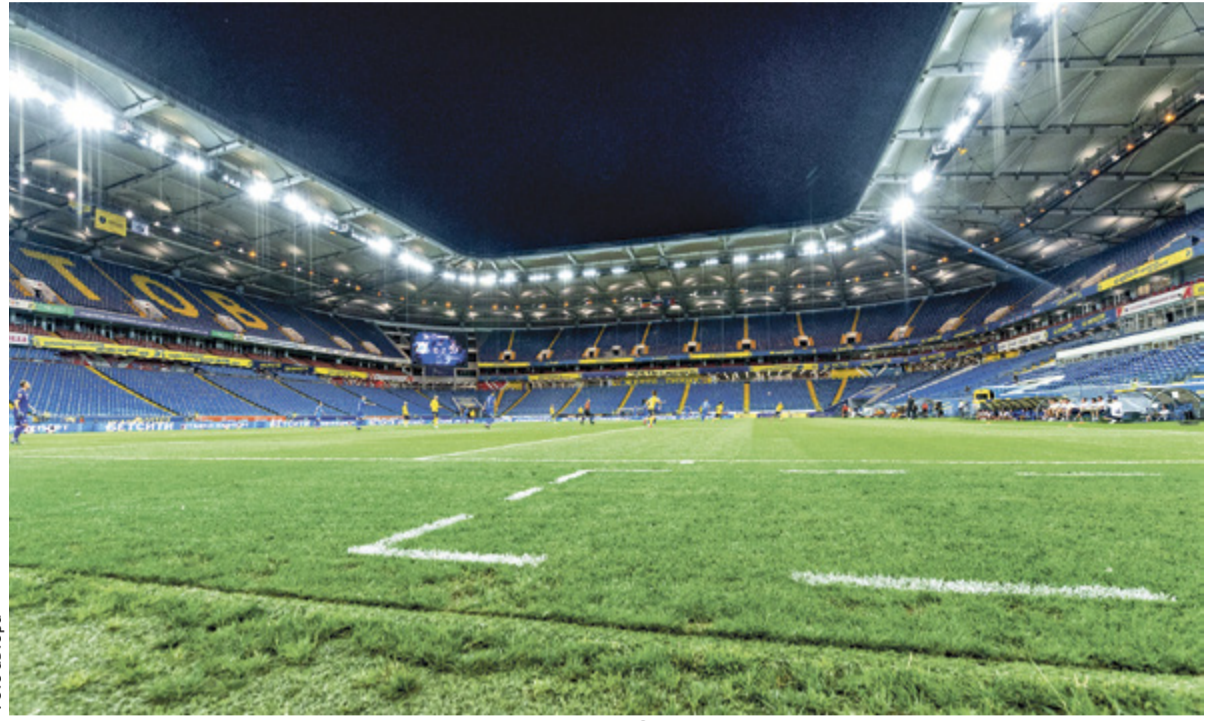
«Ростов Арена» 7 марта должна принять матч против «Сочи»