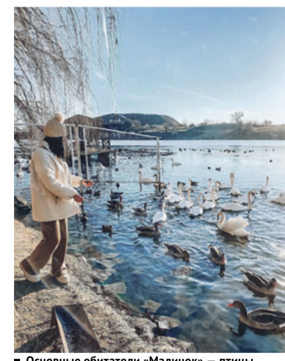
Основные обитатели «Малинок» – птицы всевозможных видов

Одной из достопримечательностей уникального донского учреждения – Южного парка птиц «Малинки», что недалеко от Шахт, неожиданно стал «кошкин дом» – симпатичная деревянная постройка-многоэтажка, предназначенная для подброшенных сюда бездомных кошек.