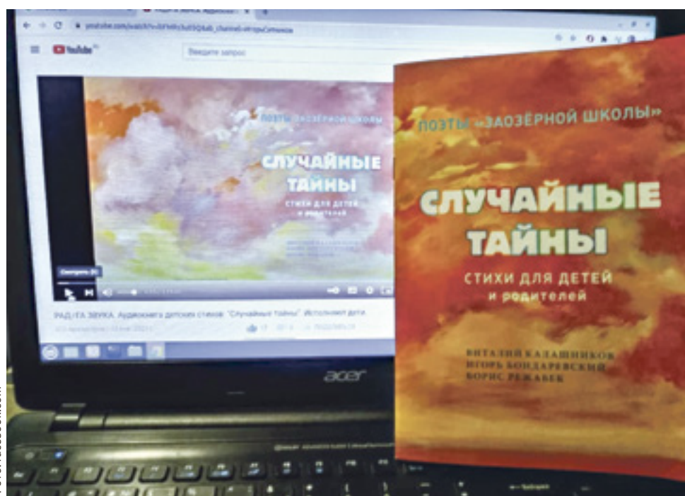
■ Аудиоверсию издания можно услышать на канале YouTube, набрав в строке поиска название проекта «Радуга звука» и название книги «Случайные тайны»

Но аудиопроjekt «Радуга звука» с названием «Случайные тайны» – это новый формат, поскольку здесь соединены музыка и поэзия в исполнении детей, и все это предназначено для самих ребят. Речь идет о стихотворениях таких поэтов,