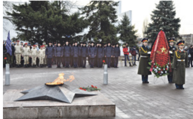
■ В минувшую пятницу у мемориала в Александровском парке почтили память бойцов, погибших при освобождении Шахт, а также замученных и казненных фашистами местных жителей