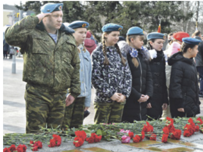
■ К братской могиле участники митинга возложили живые цветы