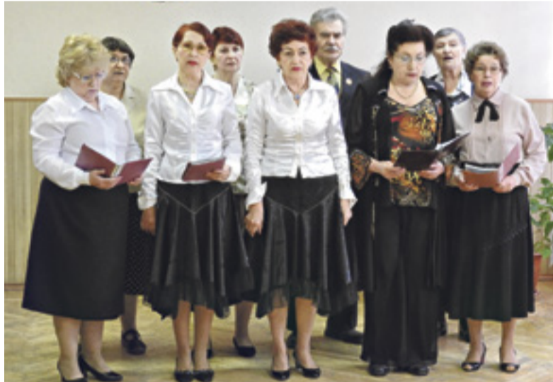
Мероприятия в центре социального обслуживания населения Первомайского района идут одно за другим

В центре социального обслуживания населения Первомайского района Ростова прошли мероприятия в рамках проекта «Грани серебряного возраста», который реализуется с использованием гранта Президента РФ, предоставленного Фондом президентских грантов. Участники играли в шахки и шахматы, выступали с номерами художественной самодеятельности.