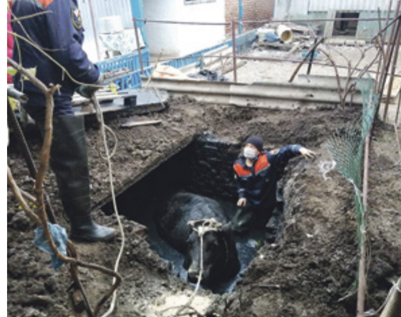
Вытаскивать животное из ямы спасателям пришлось с помощью лебедки и тросов