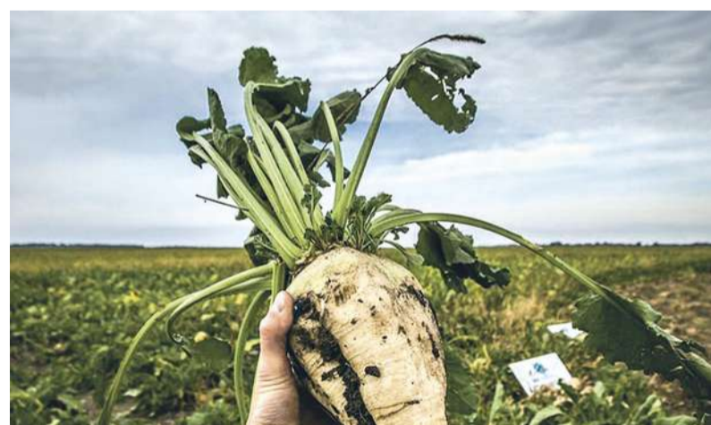
■ Будущий завод имеет перспективу увеличения мощности до 20 тысяч тонн в сутки