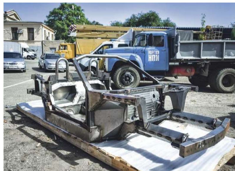
■ Несущая система третьего прототипа родстера, переданная ЮРГПУ (НПИ)