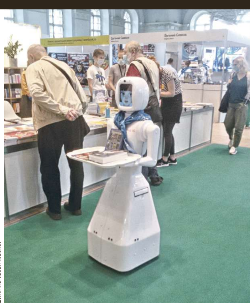
По ярмарке развезжал робот, рассказывая о книжных новинках, и это еще больше подчеркивало ценность живого общения с авторами

Захар Прилепин представил новую художественную прозу «Ополченский роман» – сборник рассказов о Донбассе, и уточнил на встрече с читателями, что они не только о войне, но и о любви. А также поделился ближайшими планами – написать книгу о Михаиле Шолохове.