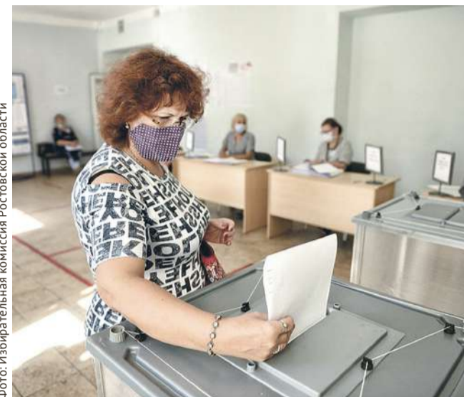
■ Отдать свой голос можно было как на избирательном участке, так и дома