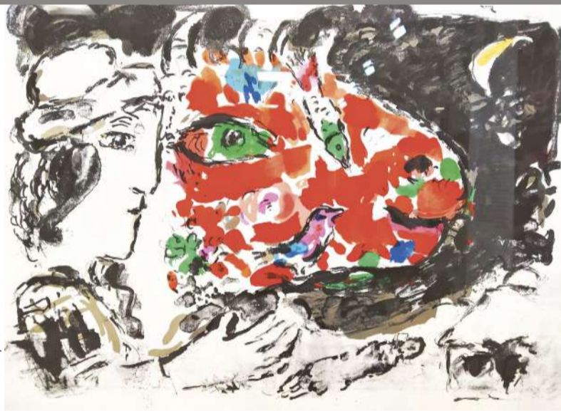
■ Работа Марка Шагала «После зимы»

В экспозиции представлена графика художника. Практически с самого начала профессиональной деятельности он относился к ней не как к технике выполнения ра-