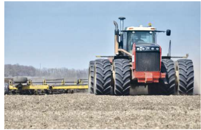
■ В посевную кампанию включились уже 28 районов области