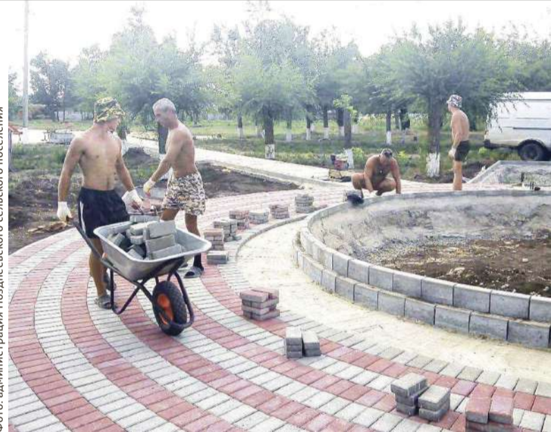
В донских селах появляются новые, важные для жителей территории для отдыха

В Позднеевском сельском поселении благоустроили парк в центре хутора. Рядом находятся школа, детский садик и детская площадка, поэтому у местных жителей это место отдыха пользуется особой популярностью. Его посетителями стали более 2000 человек. Общая стоимость материалов и работ составила приблизительно 1,8 млн рублей. Вклад жителей поселения и индивидуальных предпринимателей составил почти 140 тысяч рублей. Также местный бизнес