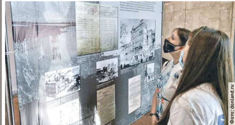
■ На выставке «Без срока давности»