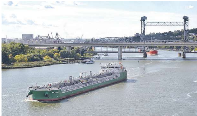
■ Правительство России намерено создавать бункеровочные базы сжиженного природного газа сразу в 15 морских портах страны, включая ростовский

Ростовский порт может стать одним из участников федеральной программы развития сети пунктов по заправке судов сжиженным природным газом (СПГ). Этот более экологичный вид топлива в перспективе должен заместить значительную часть традиционного флотского горючего – мазута.