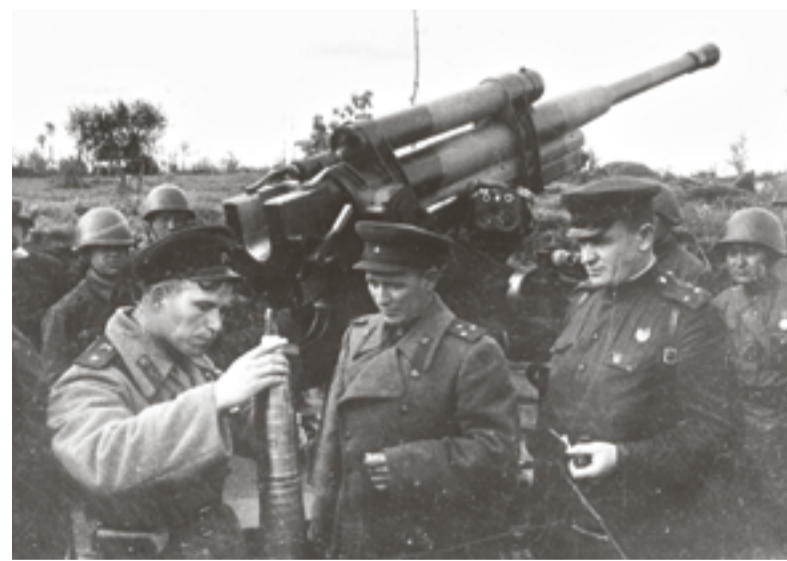
■ Михаил Шолохов (в центре) среди артиллеристов. 1943 год