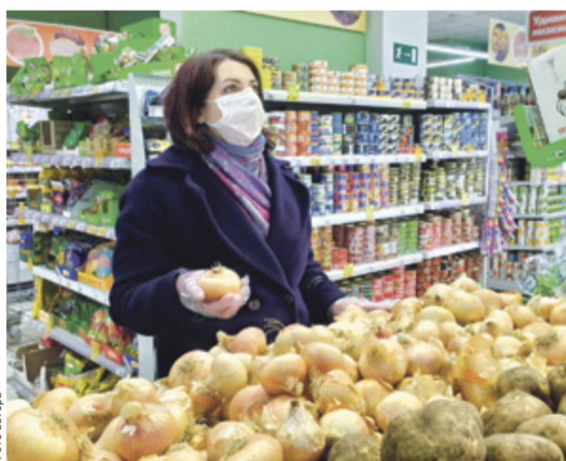
■ По данным Ростстата, со 2 марта по 12 мая лук на Дону подорожал на 102,8%, или на 25 рублей

В целом ситуация на продовольственном рынке Ростовской области опасений не вызывает.