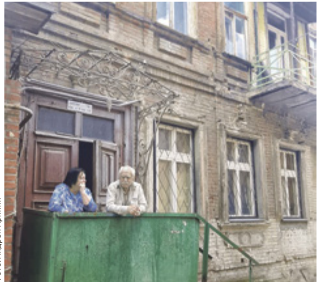
■ В Кировском районе, на улице Соколова, дома в основном старинные и требуют больших забот