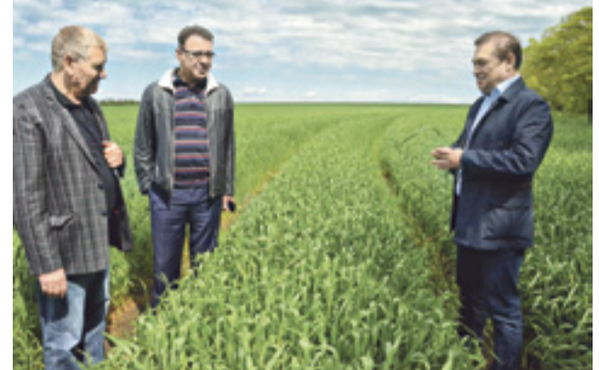
Около 90% озимых находится в хорошем и удовлетворительном состоянии