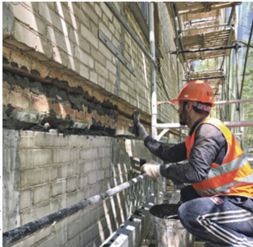
■ В прошлом году капремонт в регионе провели в 1119 многоквартирных домах

– Если увеличивать долг, не возвращая его, то когда-нибудь можно прийти к тому, что люди,