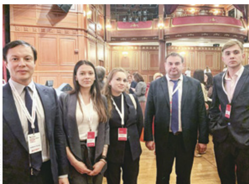
■ В октябре делегация от Ростовской области посетила форум активных граждан «Сообщество» в Белгороде

– Столица юга России – крупнейший научный, культурный и деловой центр страны. Но и другие места не менее интересны.