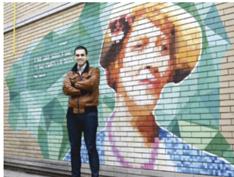
■ Портрет Фаины Раневской в роли Лели из фильма «Подкидыш» Антон Тимченко рисовал в течение месяца