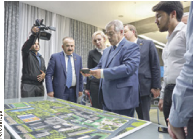
Василий Голубев знакомится с проектом нового кампуса ДГТУ