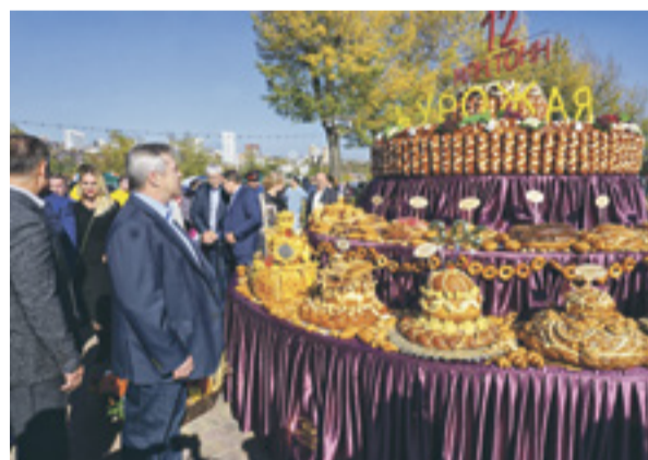
Губернатор и все караваны вместе