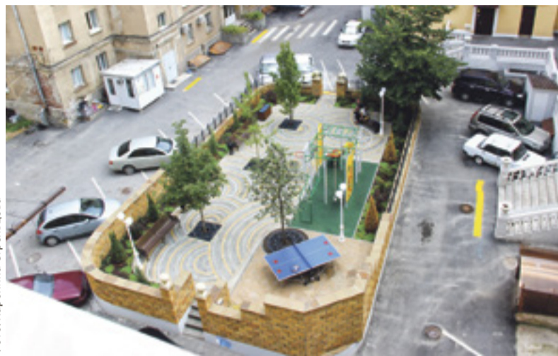
По инициативе жильцов был благоустроен двор на углу Большой Садовой и Буденновского, который прячется за кафе-кондитерской «Золотой колос» и ювелирным магазином «Рубин»

Районный форум молодежного предпринимательства с таким названием впервые пройдет в Аксае. Планируется, что в нем примут участие более 250 школьников и представители малого бизнеса. Ребята представят на конкурс бизнес-проекты. Авторы лучших из них получат призы и дипломы. Также в программе форума — лекции, мастер-классы, встречи с руководителями администрации Аксайского района, представителями Регионального агентства поддержки предпринимателей, интерактивная выставка предпринимателей. Будут работать такие образовательные площадки, как круглый стол «Успешный StartUp», юридическая клиника «Правовое обеспечение кибербезопасности инновационной экономики», консалтинговый офис «Банк», мастер-класс «Электронные торги», мастер-класс «Перспективы экспорта и рынка».