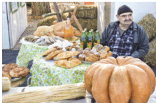
В курене Мясниковского района