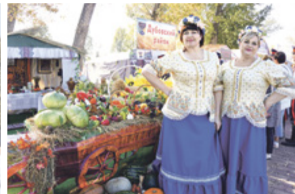
Красавицы из Красносулинского района