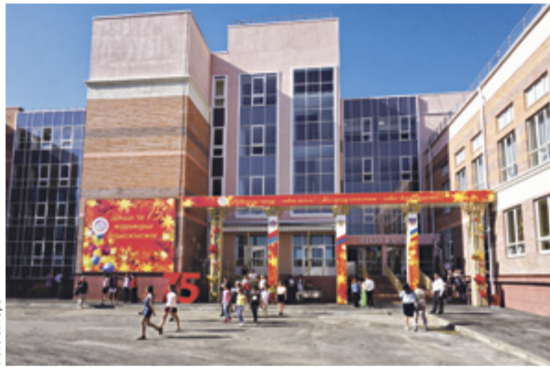
■ Средняя школа № 75, открытая в микрорайоне Суворовском в сентябре 2019 года

Продолжается модернизация среднего профессионального образования: в текущем году более 250 студентов прошли итоговую аттестацию в форме демонстрационного экзамена. В Новочеркасском колледже промышленных технологий и управления и Волгодонском техникуме металлообработки и машиностроения созда-