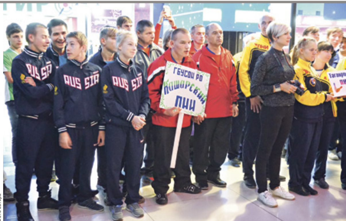
■ Участники областных соревнований по боулингу среди команд ПНИ и коррекционных школ области

Разработав положение об областных соревнованиях по боулингу, «Содружество» при помощи министерства труда и социального развития Ростовской области разослало его по подведомственным ему учреждениям. Министерство и стало основным партнером организации.