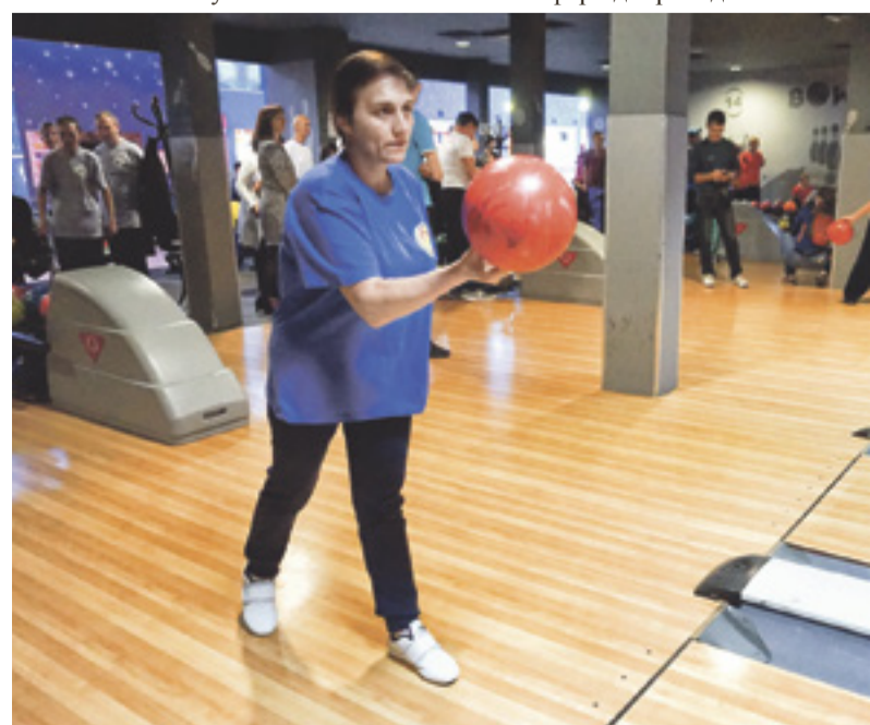
■ Участница чемпионата из Зверевского ПНИ