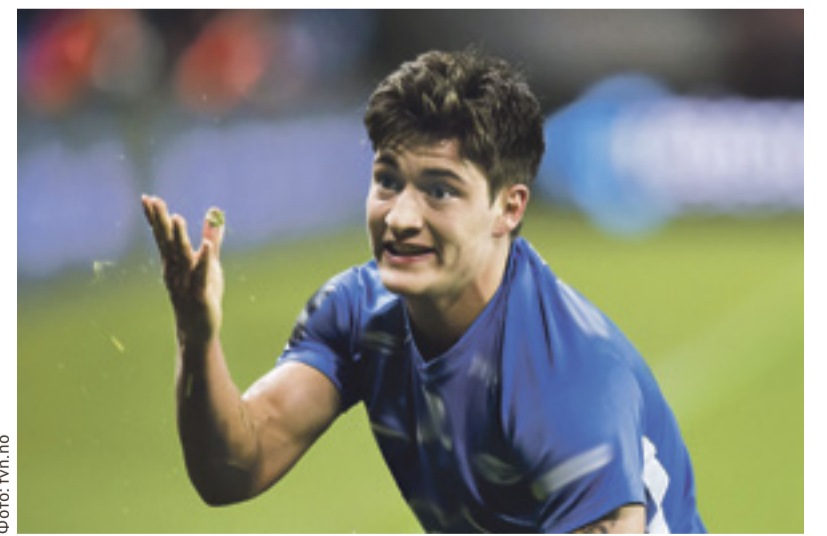
■ Матиас: «Мне и в «Ростове» хорошо»

По имеющимся сведениям, если «Ростов» будет продавать Норманна, то не меньше чем за 15–16 млн евро.