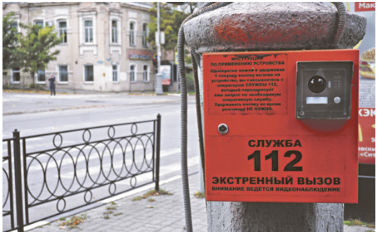
Тревожная кнопка связи со службой «Система-112»