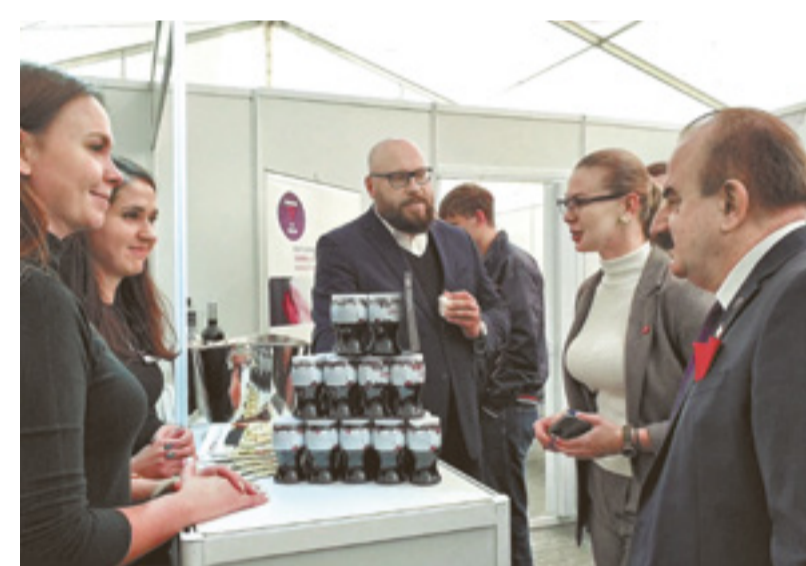
■ Новые участники территориального кластера «Долина Дона» – Восточно-европейская ассоциация сомелье и Академия сомелье Mozart House