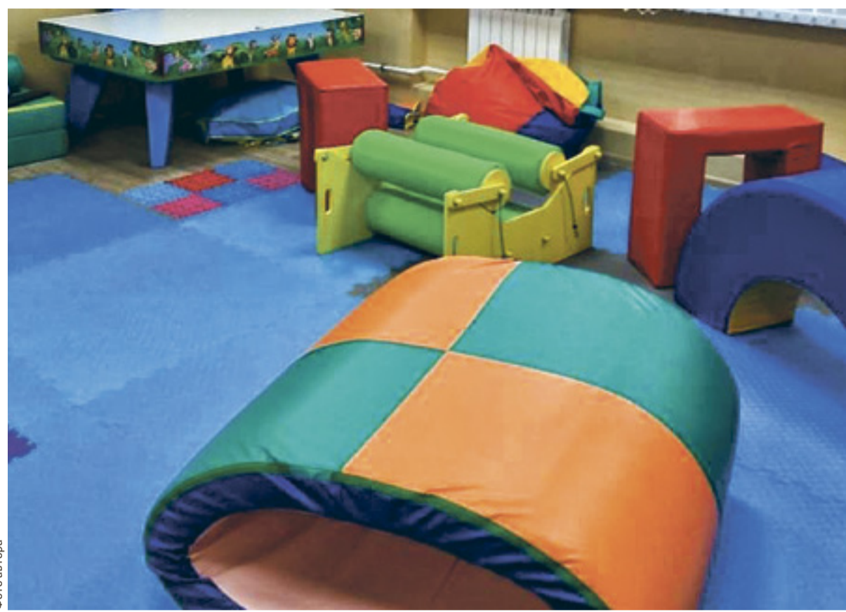
Учебные кабинеты и ресурсные зоны оснащены специализированным оборудованием

Немаловажно и то, что центр работает не сам по себе, а в связи