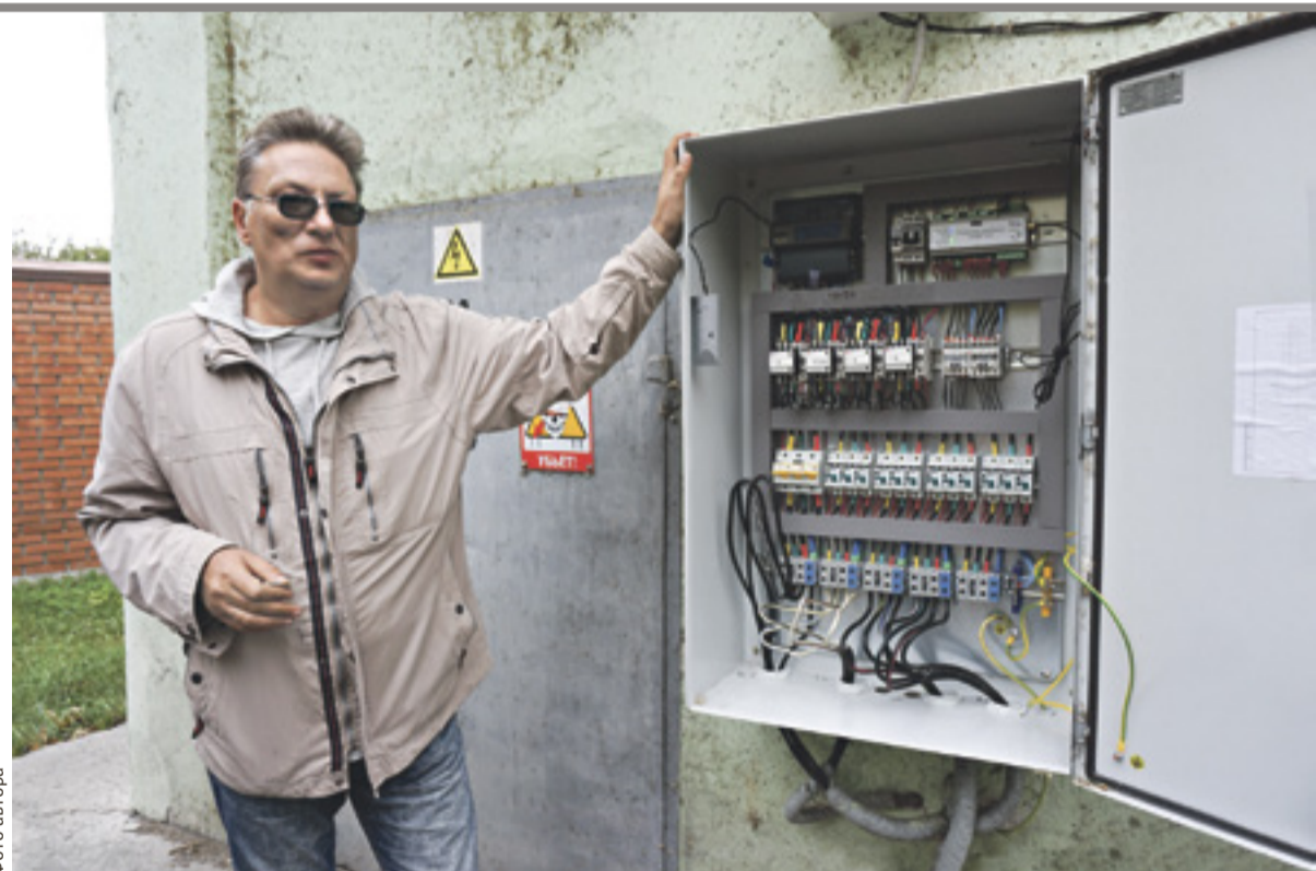
«Волшебный» шкаф, с помощью которого регулируется освещение

Данные об учениках этой школы занесены в единую городскую базу данных, что позволяет отследить передвижение школьников из одного учебного заведения в другое.