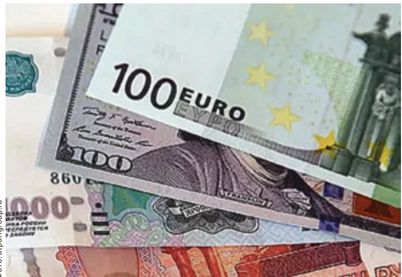
Финансово грамотными эксперты называют хранение денег в разных валютах

Ростовчане, как и жители других российских городов-миллионников, практически перестали хранить деньги в долларах и евро. Одна из причин – пропал интерес к валюте, свидетельствуют данные всероссийского исследования, проведенного аналитическим центром НАФИ.