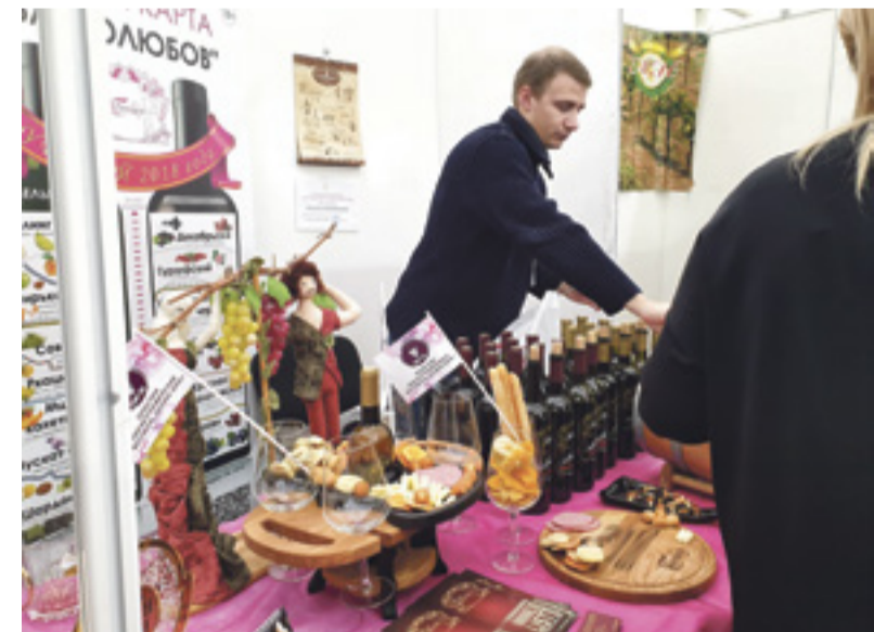
■ Стенды участников эногастрономического фестиваля «Долина Дона»