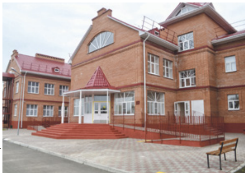
■ Новый детсад в Красном Сулине не хуже современных детских учреждений в мегаполисах

Возможность для школьников обучаться в теплых помещениях, строительство по-настоящему современного детского сада на 220 мест, новое модульное здание для педиатрического отделения райбольницы. Это – часть тех «болевых точек», от которых удалось избавиться в Красносулинском районе, выполнив указы и первоочередные просьбы людей.