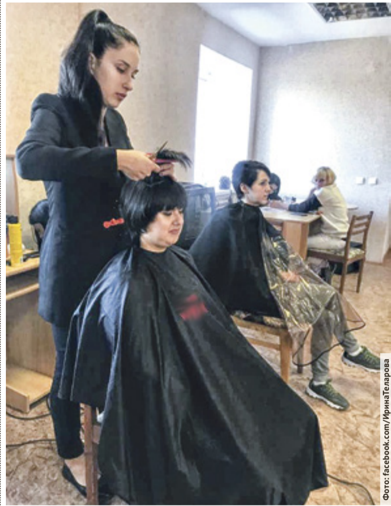
Мастера бьюти-индустрии помогли подопечным приюта преобразиться