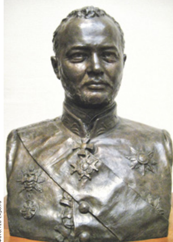
Самуил Поляков. Бюст работы М. Антокольского

С высоты полутора веков появление железной дороги в приазовских степях воспринимается как нечто величественное и прогрессивное, привнесшее небывалую динамику в ранее монотонную жизнь этого края. Это действительно была революция, только вот весь свой красочный ореол и блеск революции обретают спустя годы. Тогда же новые технологии несли разрушение старого уклада, сопровождаясь необычайно бурными процессами и сильным накалом страстей в обществе.