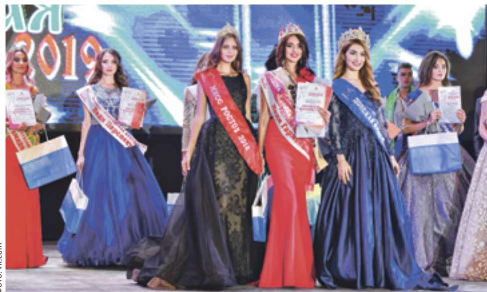
■ По мнению членов жюри, успех любит тех, кто вместо того, чтобы драматизировать проблему, начинает искать пути ее решения

Чтобы пройти в финал любого конкурса красоты и бороться за главную корону, надо не только обладать привлекательной внешностью, но и покорить зрителей и жюри творчеством,