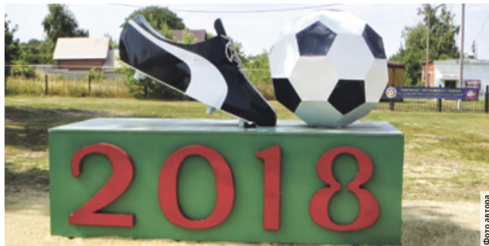
Композиция к ЧМ-2018 в поселке Чертково