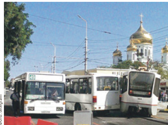
■ В Ростове в районе Центрального рынка столкнулись трамвай и автобус