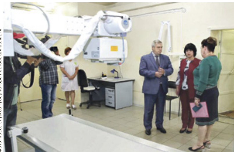
■ В ЦРБ губернатору показали, на что потратили 14,4 млн рублей, которые область выделила в прошлом году

Севилья — город на юге Испании, столица Андалусии, стал побратимом Ростова. Соглашение подписали накануне юбилея донской столицы. Подчеркивается, что два города дружат не первый год. В Ростове осуществляет свою деятельность Почетный консул Испании. А в 2017–2018 учебном году в ростовской гимназии № 53 дали старт учебной программе для двуязычных испанских отделений. Наконец, меморандум о сотрудничестве подписан между Минобразования, культуры и спорта Испании, Минобразования Ростовской области и опорным вузом региона. Сообщается, что новый статус позволит развивать социально-экономические отношения, укреплять культурные и научные связи, наладить сотрудничество в области туризма и экологии.