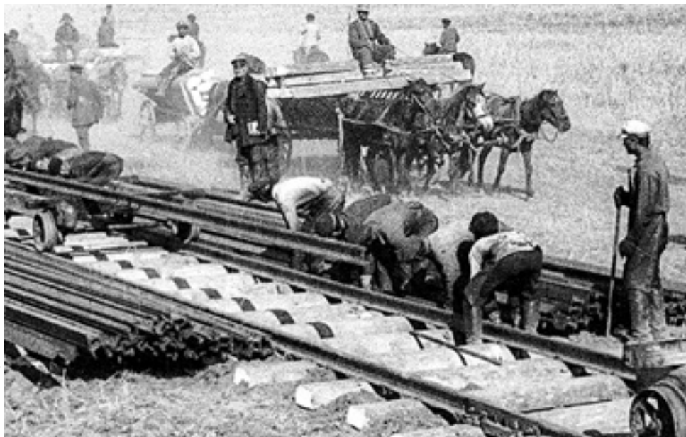
Строительство железной дороги в XIX веке

Говорят, что дорога – это жизнь. Более того – дорога способна давать жизнь. Полтора столетия тому назад на рубеже лета и осени 1869 года в Области войска Донского на водоразделе Кальмиуса и Крынки появились такие топонимы, как Ханжонково, Харцызск, Иловайск и Амвросиевка. Это были маленькие разъезды строившейся Курско-Харьковско-Азовской железной дороги, ставшие со временем промышленными центрами и транспортными узлами нынешней Донецкой Народной Республики.