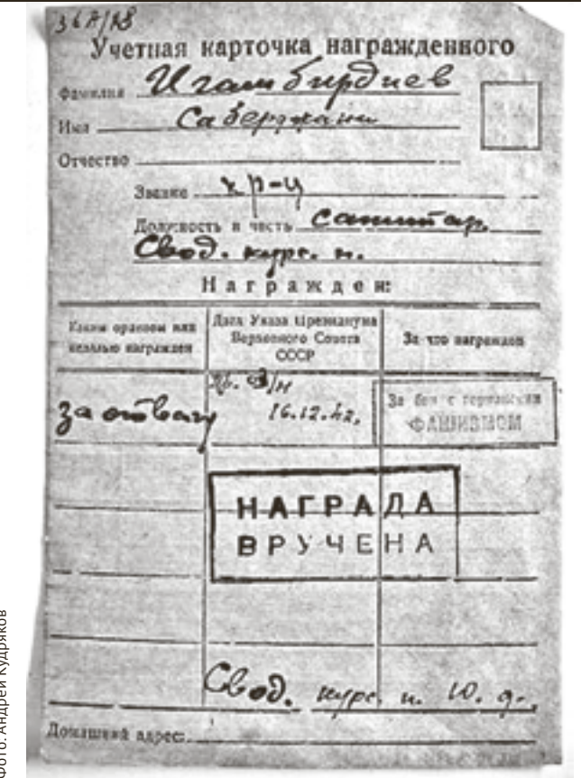
■ По номеру награды поисковики установили имя солдата

Сейчас донские поисковики вышли на связь со своими коллегами из Узбекистана и пытаются разыскать родственников воина.