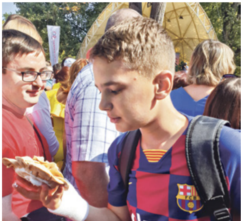
■ Ростовчане признались «Молоту», что каравай получился не только гигантским, но и вкусным