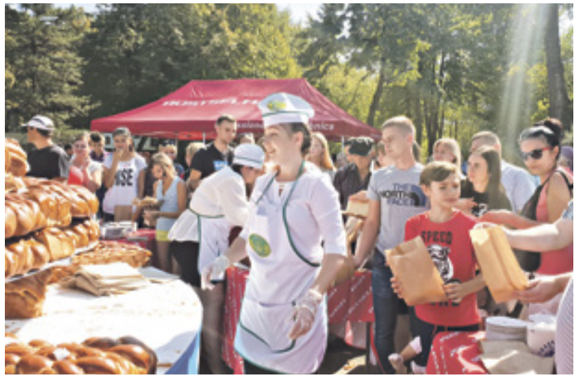
■ Свежей сдобой с удовольствием угостились более 200 гостей праздника