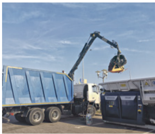
■ Во время выставки был продемонстрирован принцип работы машины с подъемным краном и двухвального подвижного измельчителя для дерева