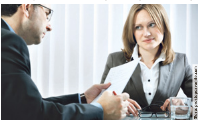
38% работодателей уверены, что положительное влияние на исход собеседования имеет наличие волонтерского опыта