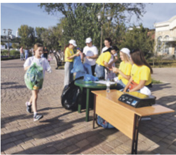
■ Участники плаггинг-забега собирали мусор в мешки, бежали с ним к столу с весами и взвешивали собранное