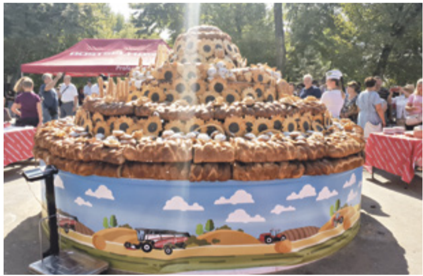
■ Каравай-рекордсмен украсила съедобная надпись «90 лет Ростсельмашу»