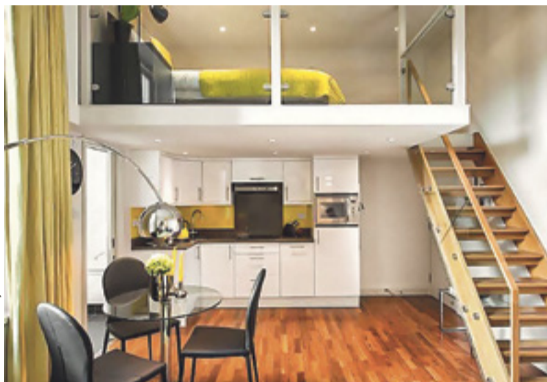
Чаще всего студии (в том числе, с жилой антресолью) берут в целях инвестиций и для сдачи в аренду, таких покупателей 60–70%