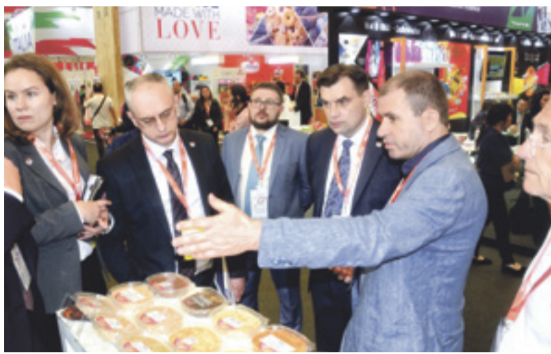
На выставке SEAL CHINA в мае этого года предприятия АПК донского региона представили продукцию масложировой отрасли, мукомольной, хлебопекарной, винодельческой промышленности, а также кондитерской отрасли