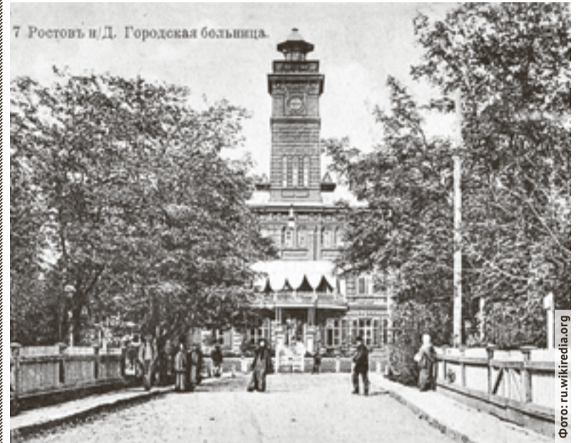
Ростовская городская Николаевская больница