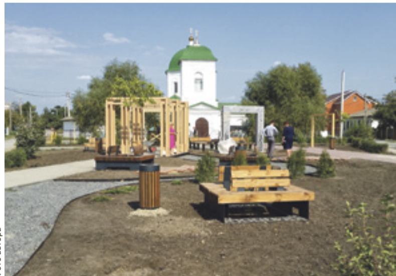
Новый сквер станет местом притяжения не только для местного населения, но и для гостей села