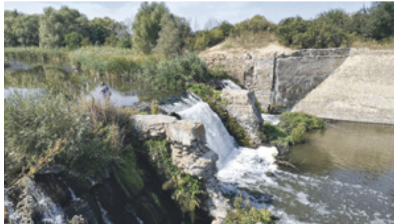
■ Бывшая (разрушенная) плотина реки Кундрючка