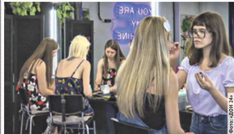
Ростовский быоти-коворкинг стал выгодным форматом аренды для визажистов, парикмахеров, мастеров маникюра