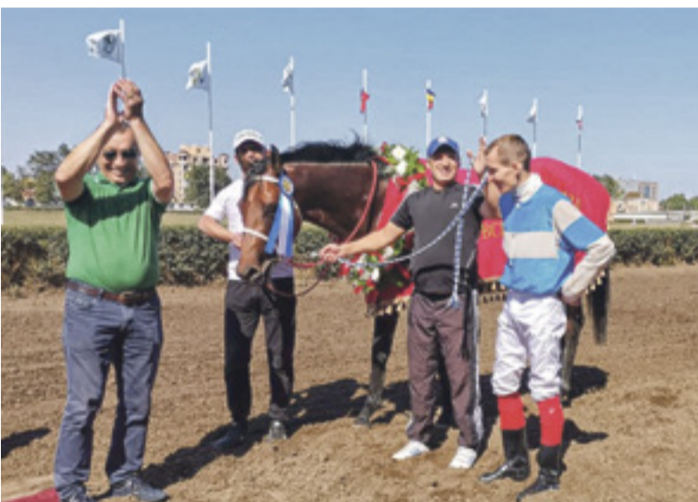
■ Победу одержал конь по кличке Бонапарт частного владельца из Пролетарского района