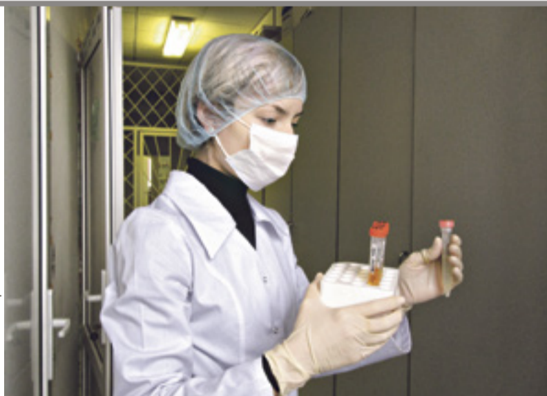
Разработка ростовских исследователей превзошла российские и зарубежные аналоги

– Могу без ложной скромности сказать, что имеющиеся зарубежные и российские аналоги уступают