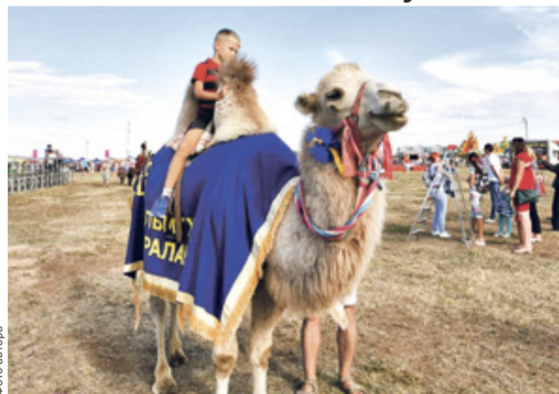
По Великому шелковому пути проходили караваны навьюченных верблюдов

В эти дни здесь проходил II Межрегиональный фестиваль «Великий шелковый путь на Дону». На большой территории расположились целые хорды из людей разных национальностей, развлечения, торговых лавок и состязаний. Окунувшись в древность, народ забывал счет времени и просто развлекался, успевай еще и узнать что-то новое, полезное.