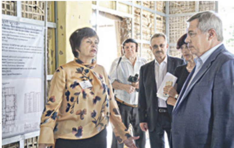
Василий Голубев и директор Цимлянского районного краеведческого музея Галина Сумцова в здании музея

— Теперь необходимо подготовить предложения о передаче в предстоящей трехлетке отдельных налогов, поступление которых непосредственно зависит от работы муниципальных образований, — уточнил поручение глава региона. По информации регионального минфина, расходная часть бюджета Ростовской области на 1 августа фактически исполнена на 112 млрд рублей, темп роста к такому же периоду прошлого года — 102,3%.