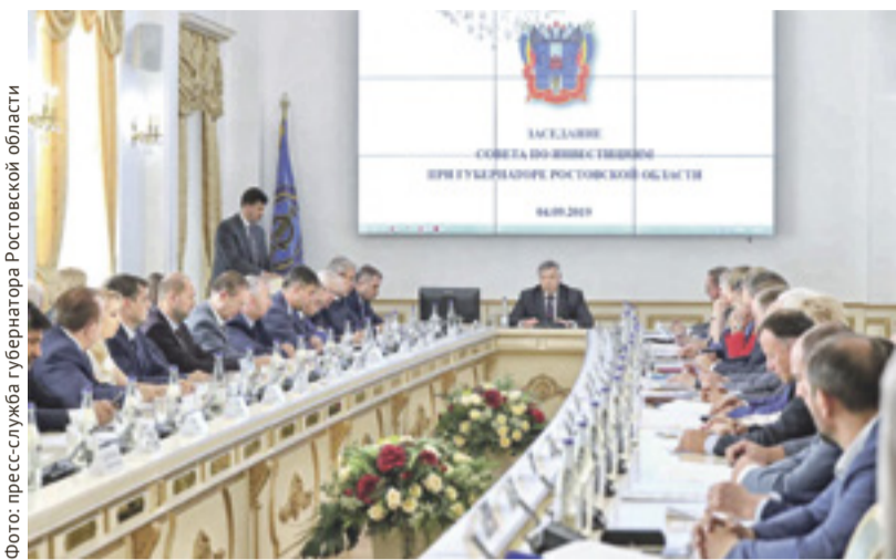
Заседание Совета по инвестициям ведет губернатор Ростовской области Василий Голубев

Необходимо оперативно реагировать на возникающие у бизнеса проблемы, считает губернатор. В качестве примера глава региона привел ситуацию с популярной у ростовчан сетью кафе «Пирог Кучкова».