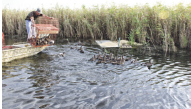
■ Оказавшись на свободе, утки устремляются в заросли камыша

– Из-за того, что на зиму плотину на Маныче открывают, весной вода затопливает птичьи гнезда. Это мешает естественному воспроизводству, и число уток сокращается, – рассказывает Дмитрий Михайлович. Поэтому забота о птичьих потомстве – тоже задача охотничьего хозяйства. На зиму, когда становится лед, егеря делают для водоплавающей птицы специальные гнезда. Набивают их соломой, сеном. Весной дикие утки прилетают на озеро, откладывают в этих гнездах яйца и остаются в наших краях. Когда проходит время, охотоведы обследуют птичьи домики и проверяют кладки. В каждой может быть от 6 до 12 яиц. На сегодняшний день, по данным учета, в Маньчском охотхозяйстве около 600 гусей, 2000 уток крякв, 4000 лысух и 2000 чирков. – Привезли крякву потому, что она для расселения приспособлена лучше других водоплавающих птиц. В неволе не будешь держать ни чирка, ни лысуху, – поясняет егерь охотхозяйства Александр Цыбин. С начала этого года на территории Ростовской области в естественную среду обитания были выпущены почти 2000 птиц: более 1000 особей утки кряквы и почти 800 фазанов. – Воспроизводство объектов животного мира – важная работа, которая должна проводиться охотпользователями на своих территориях, – отметил министр природных ресурсов и экологии региона Михаил Фишкин.