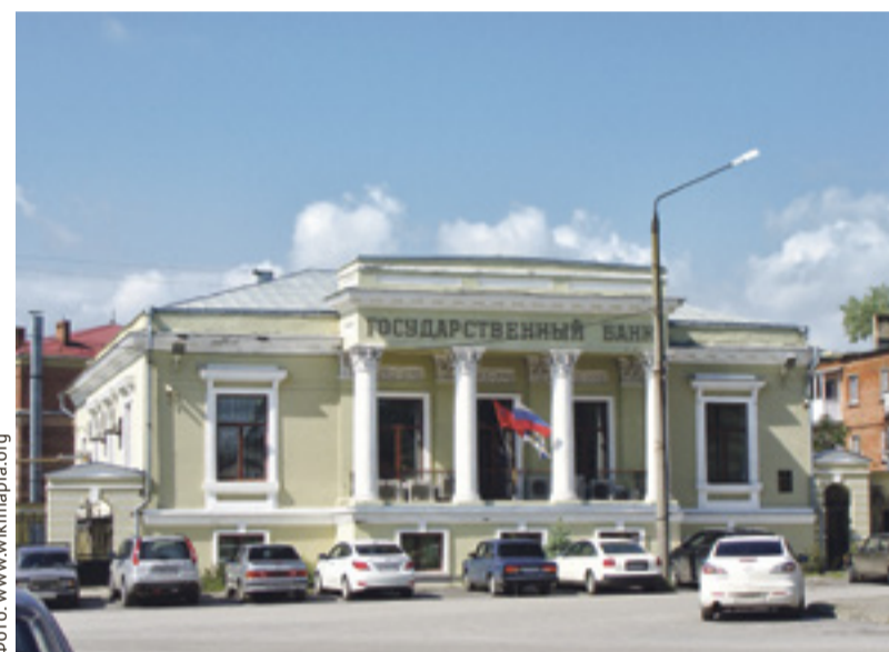
■ Здание бывшего Государственного банка в Таганроге – новый корпус Таганрогского художественного музея

Государственная программа «Доступная среда» действует в Ростовской области с 2011 года. Совместно с общественными организациями инвалидов определено 2315 объектов, подлежащих адаптации в первоочередном порядке. В настоящее время адаптированы 1523 объекта (65,8%) на общую сумму 1,6 млрд рублей.