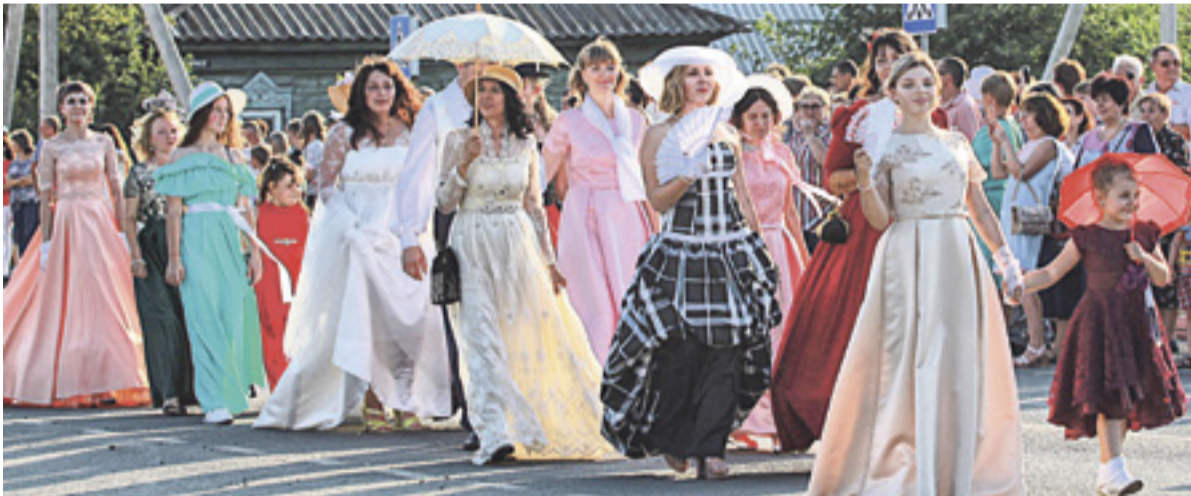
■ Жители Чертковского района прошли в праздничных колоннах, обложившись в одежду разных исторических эпох