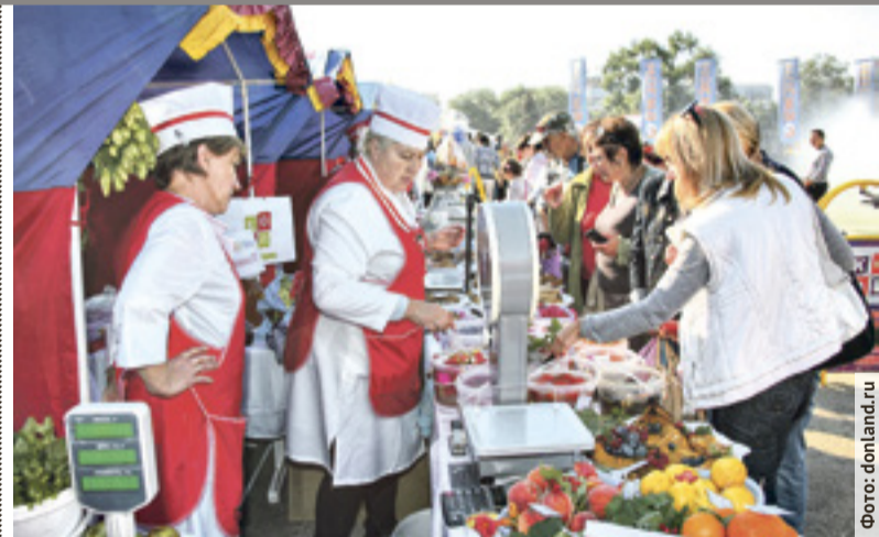
Продовольственные ярмарки очень популярны на Дону