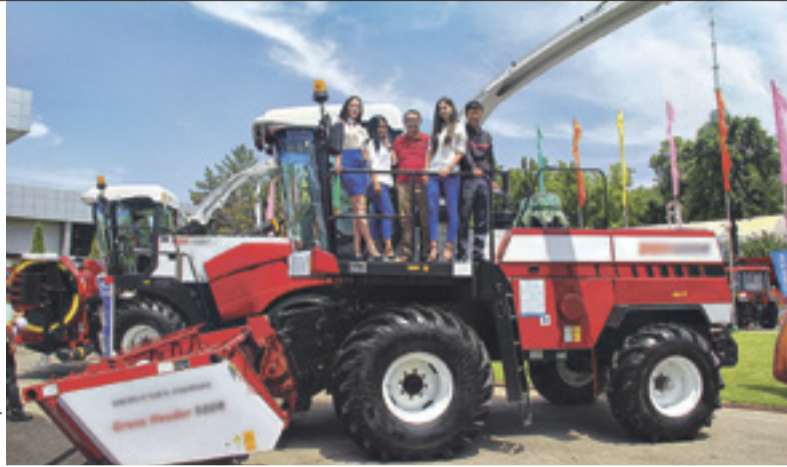
■ Техника завода «Ростсельмаш» на выставке Uzbekistan Agrotech Expo в Ташкенте