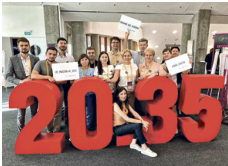
■ Команда РГЭУ (РИНХ) на закрытии образовательного интенсива «Остров 10-22»