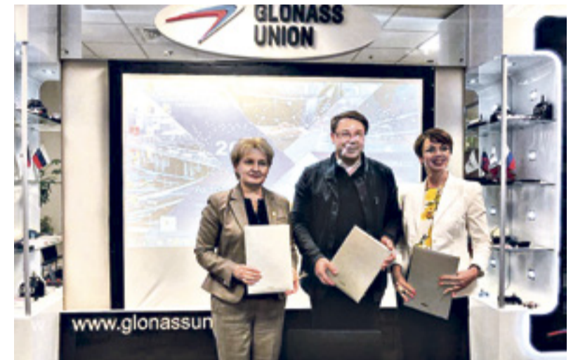
■ Подписание трехстороннего соглашения о сотрудничестве между РГЭУ (РИНХ), НП «Содействие развитию и использованию навигационных технологий», Ассоциацией разработчиков, производителей и потребителей оборудования и приложений на основе глобальных спутниковых систем «ГЛОНАСС/ГНСС-Форум»