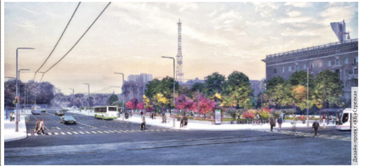
■ Дизайн-проект благоустройства главной площади Ростова-на-Дону