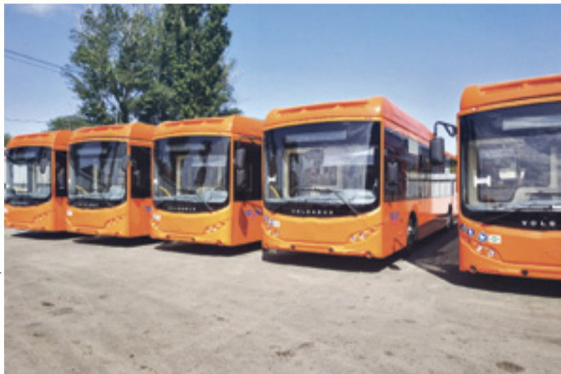
■ Эти автобусы Volgabus (г. Волжский) на маршрутах Ростова-на-Дону работают на экологически чистом газомоторном топливе – метане

К 11 действующим в Ростовской области автомобильным газонаполнительным компрессорным станциям до конца этого года прибавятся еще 13, сообщил на расширенном заседании правительства министр транспорта Ростовской области Андрей Иванов.