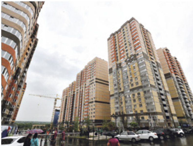
■ Ключи от новых квартир в микрорайоне Красный Аксай получили почти 500 обманутых дольщиков