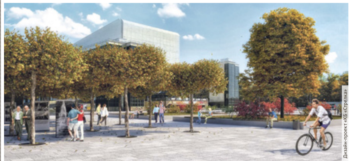
■ Территория у театра имени Максима Горького