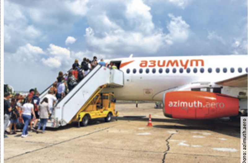
■ При участии специалистов Региональной корпорации развития «Азимут» разработал маршрутную сеть по 24-м направлениям

Таким образом, теперь, с включением в проект, жители Дона одними из первых смогут воспользоваться персональными цифровыми сертификатами – стимулирующими выплатами для изучения базового программирования, основ работы с данными или коммуникации в современной цифровой среде.