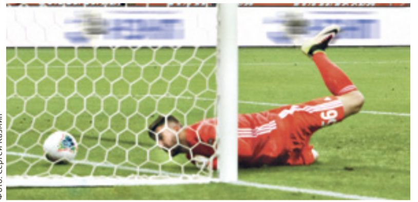
■ «Оренбург» сдался в первом тайме

Чем же объяснить такую разницу в количестве зрителей на матчах в Ростове и Грозном? Разным статусом поединков? Типа, в гости к «Ахмату» приехал более именитый соперник. Но ведь, к примеру, «Крылья» в прошлом году на «Ростов Арене» собрали 31 тысячу зрителей.