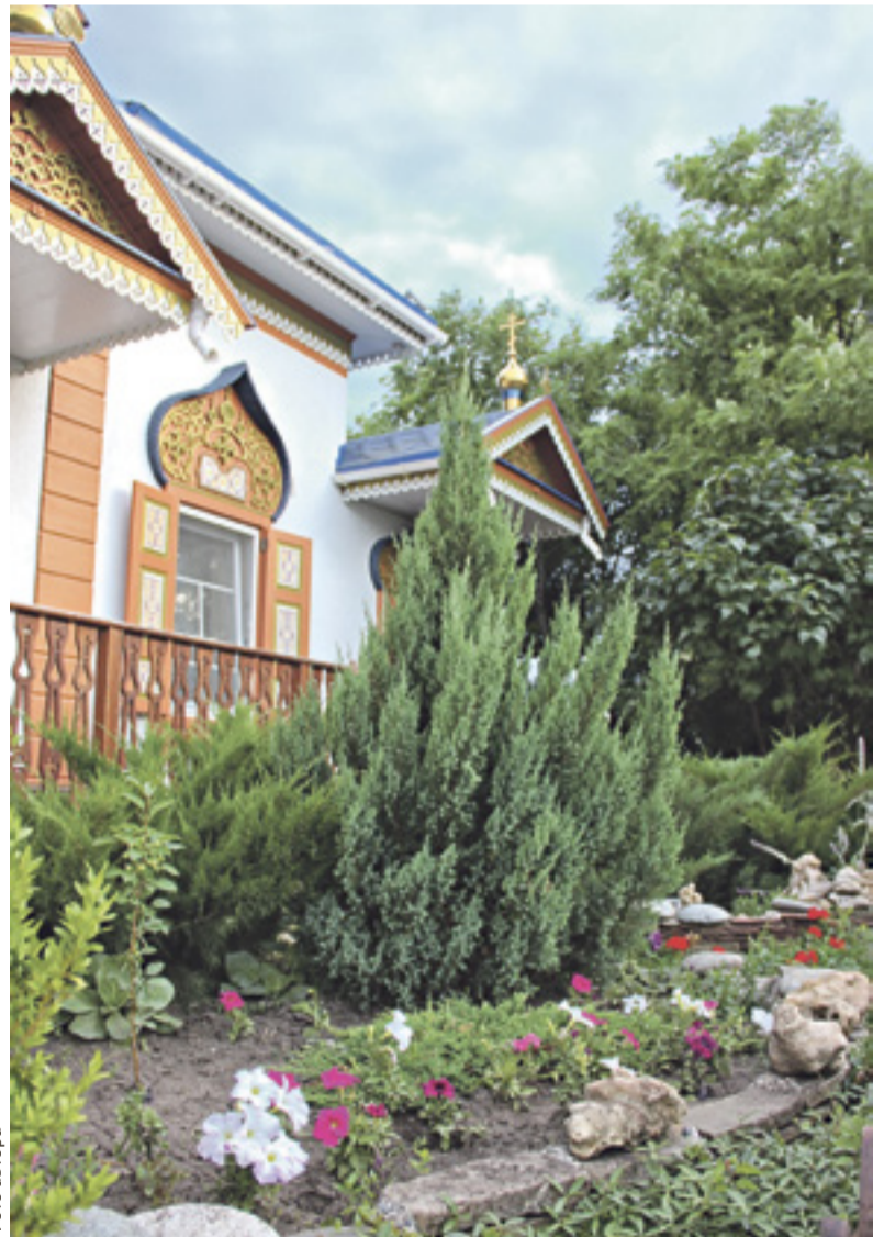
■ Хутор поражает не только куренями и видом на Дон, но и прекрасными цветами