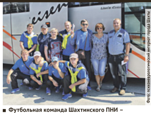
■ Футбольная команда Шахтинского ПНИ – одна из победительниц финального турнира

И еще один примечательный момент: у интерната есть свое фут-