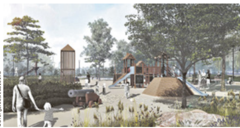
■ По проекту, в новом парке «Донской» будут детские площадки и пешеходные дорожки

В планах – строительство еще одного парка, под названием «Донской», уже на 6 га, с клумбами, детской площадкой, пешеходными и велосипедными дорожками, местом для реконструкций исторических событий и проведения казачьих шермичий. Проект финансируется из областного бюджета. При этом станице Старочеркасской как историческому поселению на благоустройство выделено из федеральной казны больше 50 млн рублей за победу в конкурсе лучших проектов создания комфортной городской среды.