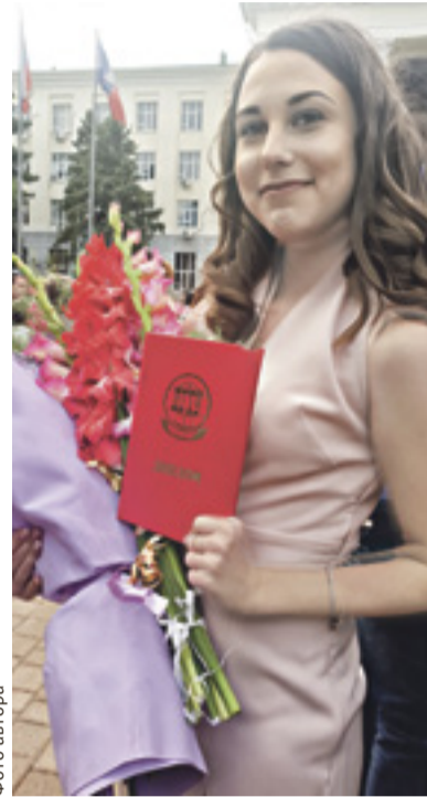
Лучшие выпускники вуза получили дипломы из рук главы региона

– ДГТУ сегодня является опорным университетом – одним из ключевых звеньев в развитии экономики области. Популярность ДГТУ возросла: его студентами в прошлом году стали 23% выпускников школ. Это первое место среди вузов в регионе. Уверен, ребята с легкостью вольются в большой трудовой коллектив