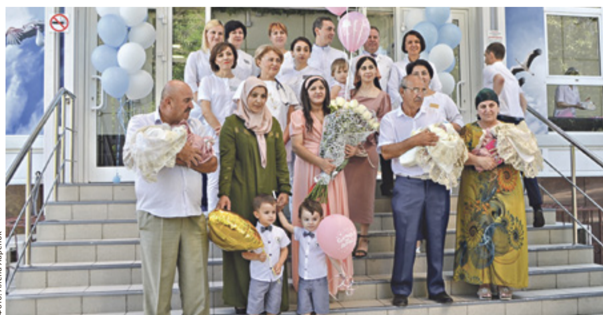
■ Счастливую семью провожают из НИИАПа