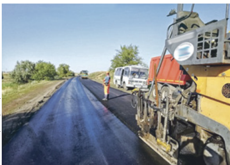
После выравнивающего слоя будут выполняться работы по устройству асфальтобетонного покрытия толщиной 4 см

Ситуация должна измениться в лучшую сторону уже в конце сентября, когда Минтранс РФ опубликует в электронном виде общедоступный реестр лучших технологий строительства дорог. Появление нового ресурса,