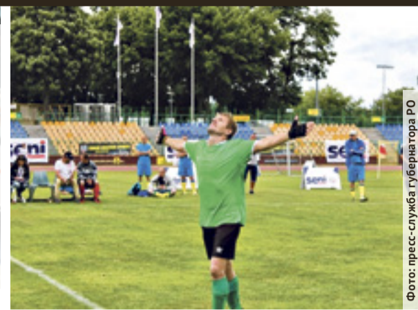
■ Радость победы

больное поле, пусть простенькое, но обустроенное руками игроков. Даже места для болельщиков следаны, а болеть, когда проходят состязания внутри интерната, приходят многие. Тренировки проходят три раза в неделю.