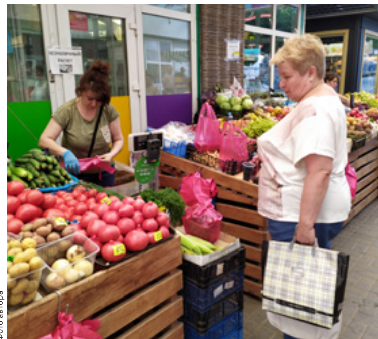
■ На некоторых рынках за покупки уже можно расплачиваться, как и в супермаркетах – банковскими картами

Ранее в ФНС заявляли, что с помощью современного аппарата легко можно отследить и оценить результаты продажи при наличии двух точек товарооборота. Кроме того, новая технология избавляет малый бизнес от лишней отчетности. Благодаря онлайн-кассам количество налоговых проверок на Дону сократилось уже в 10 раз. Еще один немаловажный эффект: как отмечают эксперты, выручка по каждой онлайн-кассе практически вдвое больше, чем при работе с прежними аппаратами.