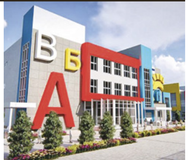
■ Проект школы на 1100 мест в микрорайоне Красный Аксай

Но в реализации программы есть и ложка дегтя: некоторые объекты будут построены с опозданием. Это, в частности, вторая школа в Левенцовке (теперь