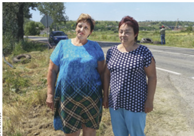
■ В хуторе Веселом идет прокладка водопроводных труб