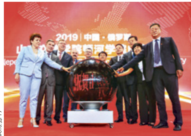
■ Образовательную площадку донского вуза открыли в китайской провинции Шаньдун

тайские связи в области образования заметно набирают обороты. Как заявил на недавнем брифинге для китайских СМИ, прошедшем в Москве, министр науки и высшего образования РФ Михаил Котюков, сейчас в российских вузах учатся около 30 тысяч студентов и аспирантов из Поднебесной, а в вузах Китая – порядка 20 тысяч россиян. А с учетом краткосрочных программ и курсов по обмену эти цифры скоро увеличатся в несколько раз.