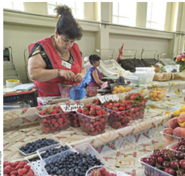
■ В отдельных торговых точках готовы принимать плату через телефоны