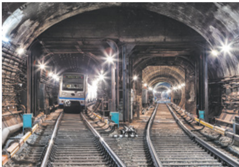
Поезд «Русич» в тоннеле московского метро