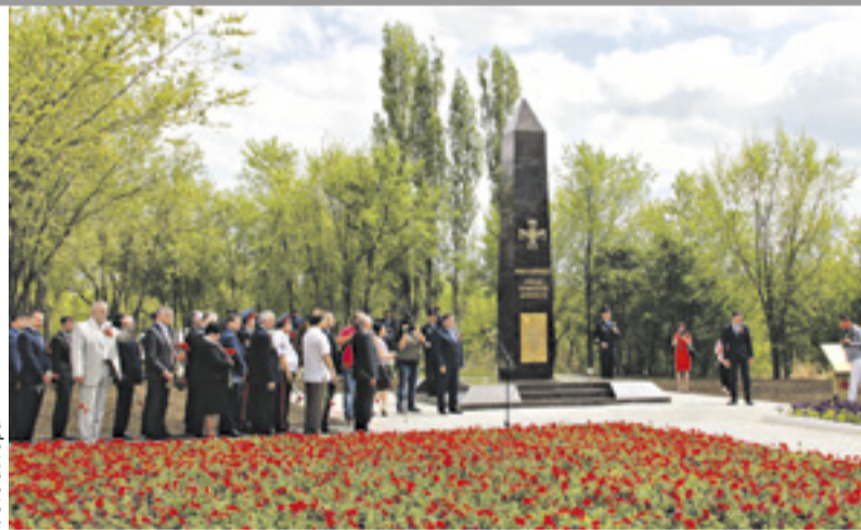
■ Стела «Город воинской доблести» установлена в Миллерово на улице Артиллерийской

Свыше 110 тысяч человек приняли участие в акции «Бессмертный полк» в донской столице. По словам губернатора, шедшего в первых рядах с портретом своего деда, в области в колоннах «Бессмертного полка» прошли свыше 290 тысяч жителей Дона.