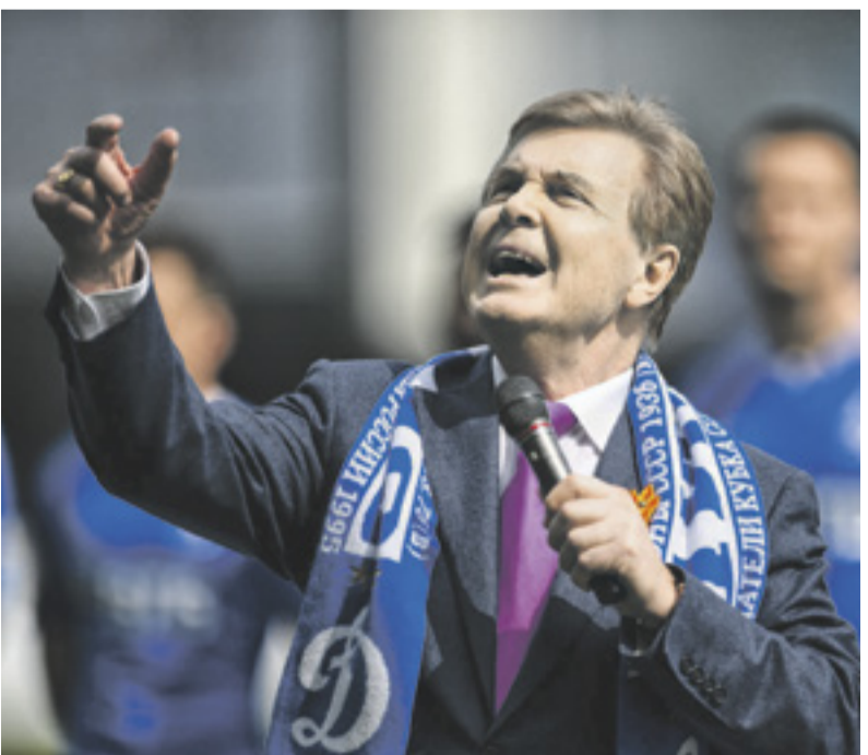
■ «Этот День Победы порохом пропах...»