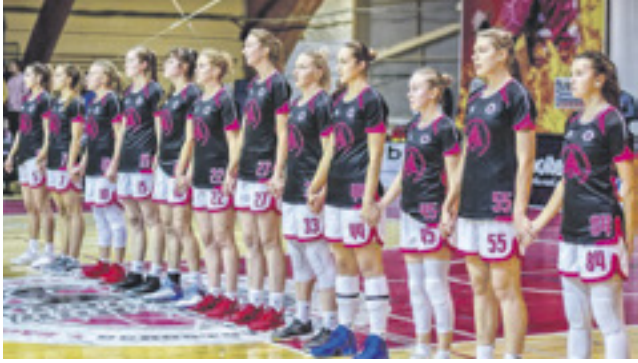
У баскетболисток «Ростов-Дон-ЮФУ» – европейская «бронза»