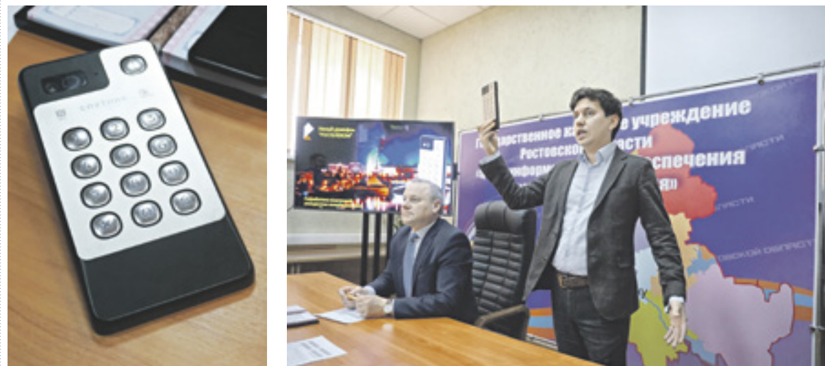
На презентации «умного» домофона в департаменте по предупреждению и ликвидации чрезвычайных ситуаций Ростовской области