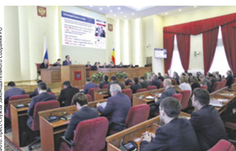
Расширенное заседание правительства

– Задача должна быть выполнена в полном объеме. Очень неприятно, когда дети-сироты приходят и жалуются на качество предоставленного жилья. Тут два варианта решения: или мы снимаем проблему, или мы снимаем главу муници-