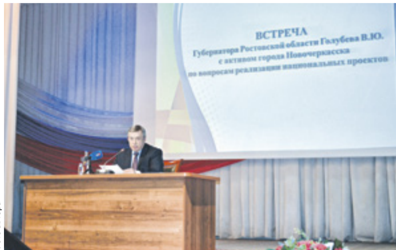
■ Ключевой темой встречи Василия Голубева с общественностью Новочеркасска стало воплощение в жизнь национальных проектов

– Реализацию нацпроектов нельзя вести в кабинетах, – акцентировал глава региона. – Очевидно и то, что выполнить настолько масштабные, амбициозные задачи невозможно, не пригласив к сотрудничеству, не подключив специалистов всех отраслей и сфер. Нужна по-настоящему командная работа! Без отраслевых экспертов, без бизнеса, научного сообщества, без депутатского корпуса и активных жителей нашего региона выполнить эту работу невозможно. А