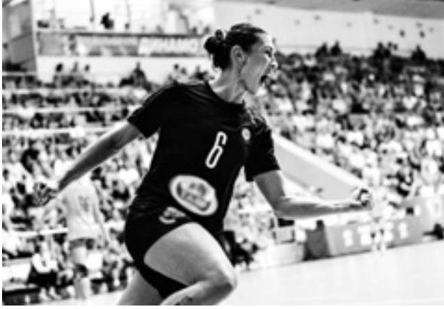
Фото: ГК «Ростов-Дон»