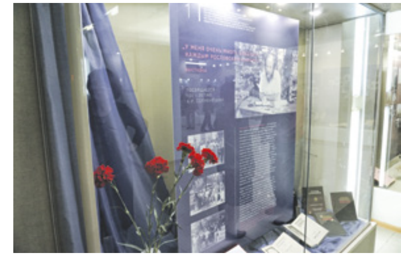
■ Одна из витрин выставки, посвященной 100-летию Александра Солженицына в РОМК