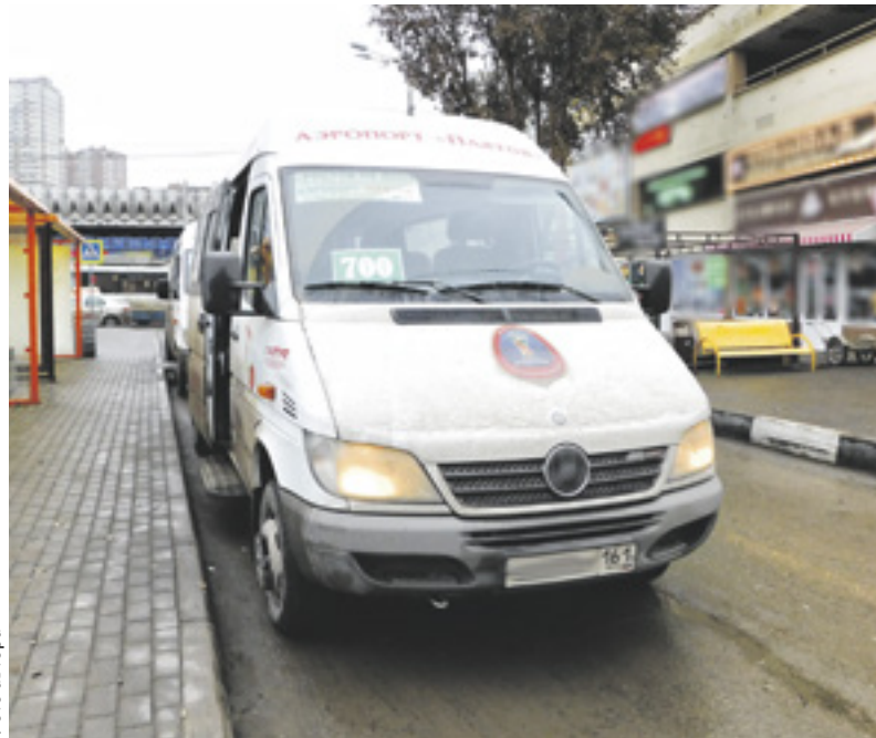
■ Пока до Платова идут автобусы малой вместимости, но скоро их можно будет увидеть только ночью, обещает минтранс РО

Представители туристической отрасли также считают, что в следующем году необходимо организовать работу по привлечению транзитных туристов и продумать туры выходного дня.