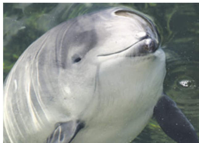
■ Азовка, она же морская свинья

Родом из далекой эры Вопрос, откуда взялись