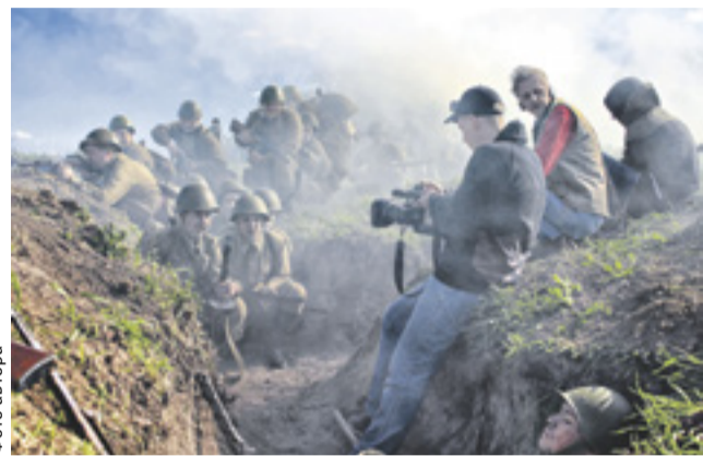
Рабочий момент съемки фильма «Шли бои местного значения»

В Донском государственном техническом университете состоялась премьера художественного фильма о бойцах Миус-фронта «Шли бои местного значения». Картина снята силами опорного вуза и Ростовской региональной общественной военно-патриотической молодежной организации «Донской фронт».