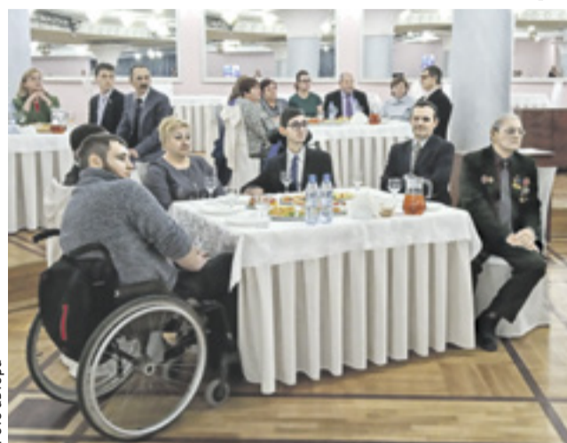
■ На приеме в честь Декады инвалидов в Ростовском музыкальном театре

Более 1,4 млрд рублей пошло на адаптацию для инвалидов почти 1300 объектов социальной инфраструктуры