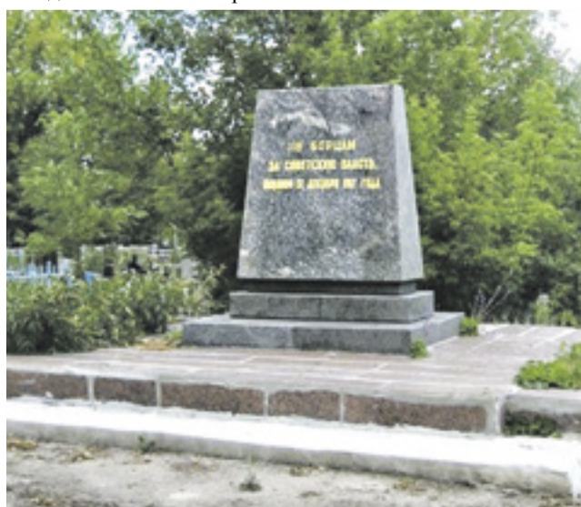
■ Памятник участникам восстания на Ясиновском руднике (г. Макеевка, ДНР)

После случившегося Василий Чернецов прожил еще три недели. 21 января 1918 года он был убит красными при не до конца выясненных обстоятельствах. Так произошел один из первых обменов сакральными жертвами в разгорающейся Гражданской войне.