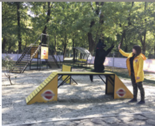
■ Первая площадка для выгула собак в парке им. Н. Островского

Площадка зонирована на две части: активную со снарядами и пассивную, где собаки смогут резвиться. Также предусмотрены зоны отдыха для владельцев. Объем инвестиций в проект не разглашается. По данным компании, до конца года планируется открыть еще три площадки для выгула собак в различных парках и скверах Ростова-на-Дону. В приоритете – локации в Ворошиловском и Октябрьском районах. Их жители наиболее активно голосовали.