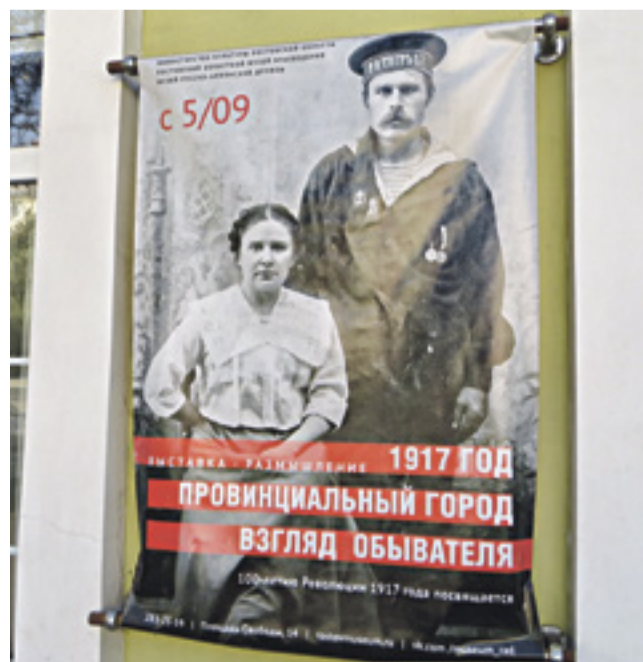
■ Афиша выставки «1917 год. Провинциальный город. Взгляд обывателя»

В музее русско-армянской дружбы (отдел РОМК) на площади Свободы в донской столице открылась необычная выставка. Она называется «1917 год. Провинциальный город. Взгляд обывателя» и посвящена тому, как обычные жители Дона воспринимали события 1917 года.