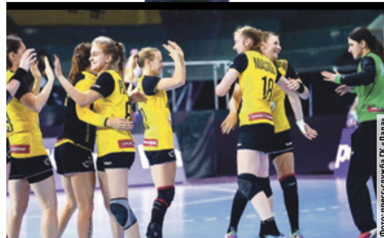
■ Ростовские гандболистки радуются очередной победе. А как будет в субботу?