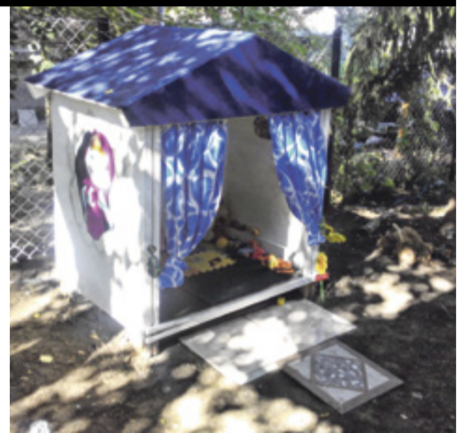
■ На благоустройство двора жители потратили 14 тыс. руб.

ке – дело рук отзывчивой художницы-ростовчанки. На создание сказки жильцы потратили 14 тысяч рублей, половина из которых ушла на возведение