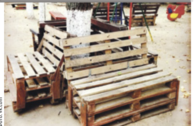
■ Самодельные лавочки в одном из ростовских дворов

«В самом центре Ростова в одном из тихих дворов появилась такая композиция. Первая моя реакция – восторг. Надо же, умельцы нашли применение складским паллетам, дали мусору вторую жизнь!» – написал автор поста.