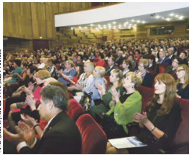
■ Торжественный прием в честь Дня учителя

На торжественном приеме педагогам были вручены медали «За доблестный труд на благо донского края», благодарности губернатора Ростовской области, нагрудные знаки «Лучший работник образования Ростовской области» и другие награды.