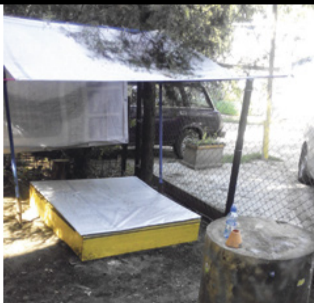
■ На Каменке появилась сказочная детская площадка

Многие жильцы изготовили из подручных материалов. Турник нижегородского производителя обошелся в 6000 рублей, еще 1000 потратили на покупку семян для засева